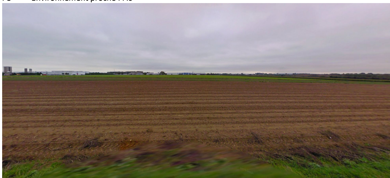
P4 – Environnement proche PA6