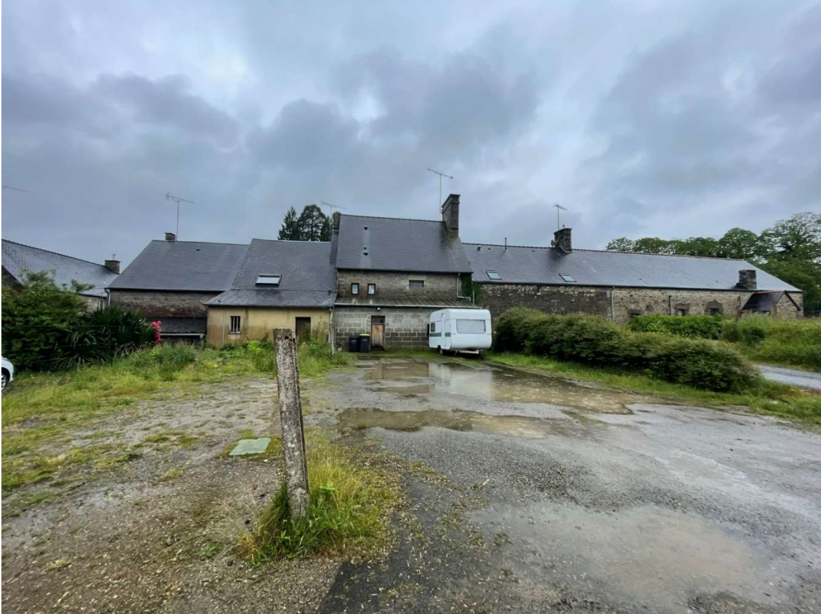
Photo de la partie basse du hameau des Vallées, le 5/5/2026