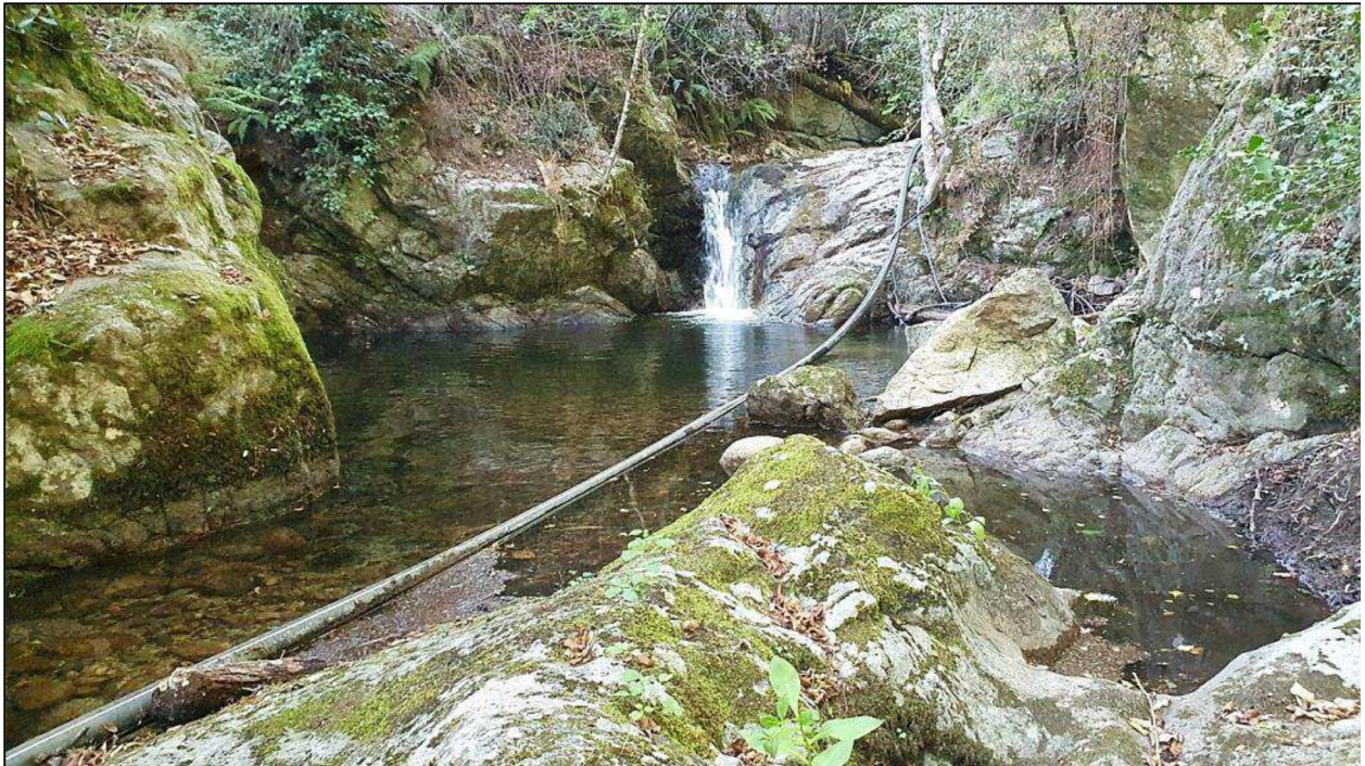
Le torrent de CHIOVA (août 2024)