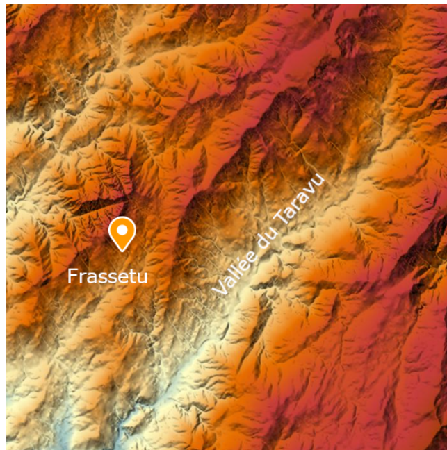
FIGURE 2 – Bassin versant et Taravu

Le dossier de consultation du public contient des éléments cartographiques localisant le projet et les différents ouvrages afférents. Comme indiqué lors de la réunion préparatoire à la consultation du public par le Commissaire Enquêteur, cette cartographie est réalisée à une échelle trop petite pour situer précisément les ouvrages. Seule la zone assise de la prise d'eau bénéficie d'une cartographie à l'échelle parcellaire.