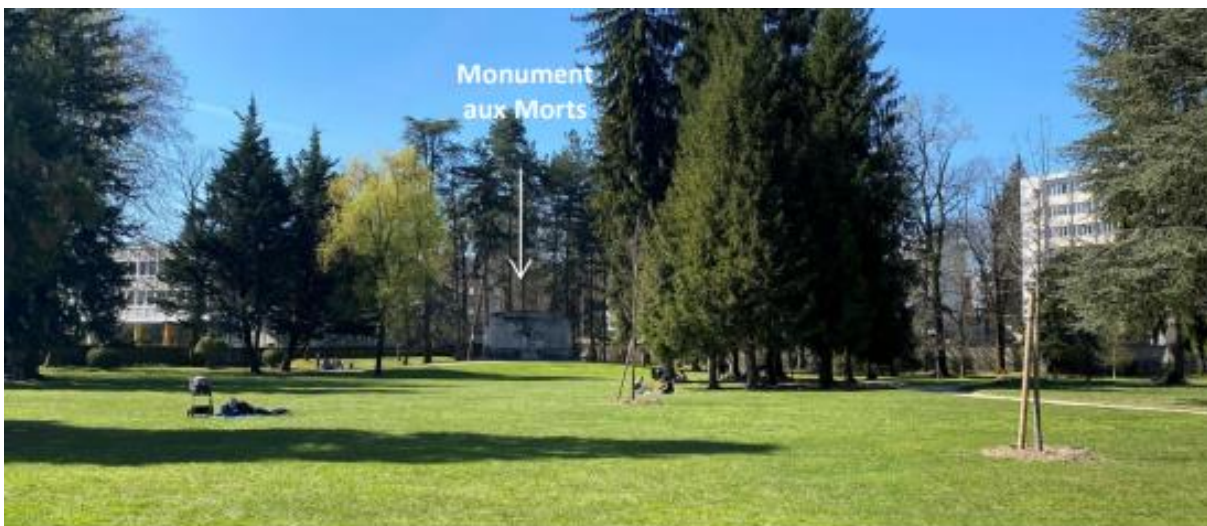
J - Vue panoramique depuis le jardin de ville vers le Monument aux Morts

Le monument aux morts de la ville de Voiron a été créé en 1924 dans le jardin de ville. Il a été inscrit par arrêté le 13 mars 2019 sur la liste supplémentaire des monuments historiques. Installé au sud-ouest du jardin de ville, le monument n'est pas perceptible de l'extérieur du jardin, qui est délimité par de hauts murs périphériques. Le monument est situé, de plus, dans un endroit planté d'arbres de haute tige, dans la partie la plus calme et la plus arborée du parc.