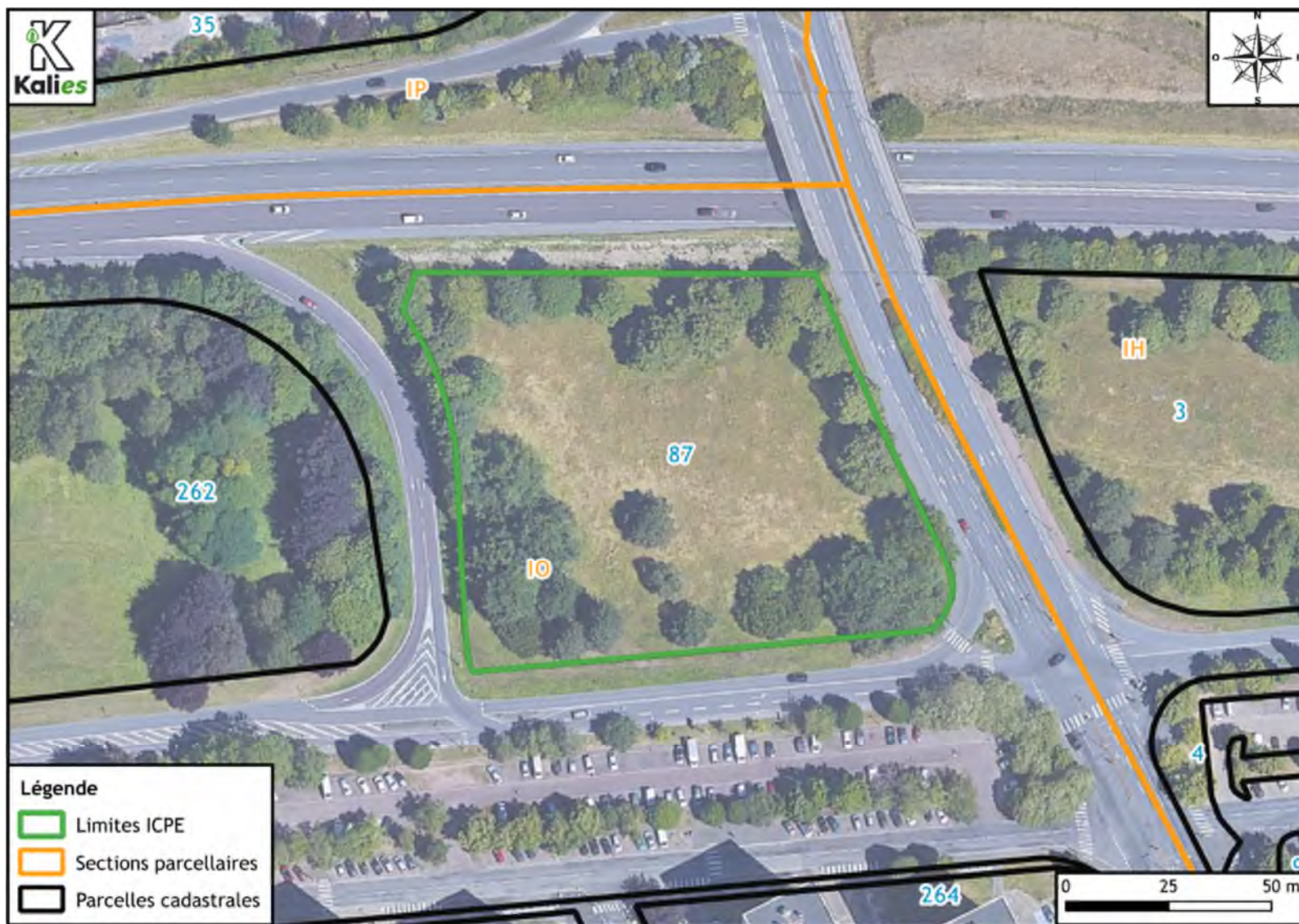
Figure 1. Plan cadastral