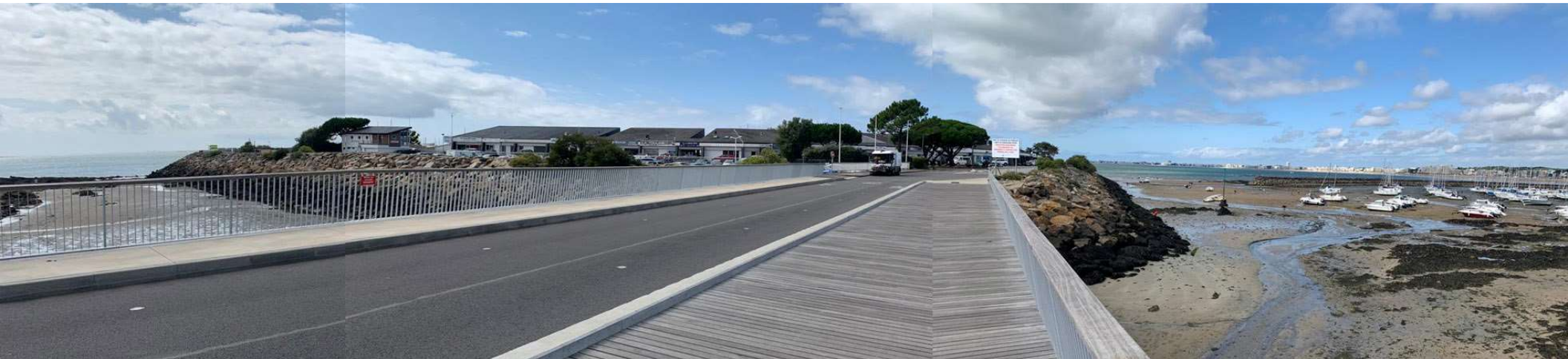
PA 06 H