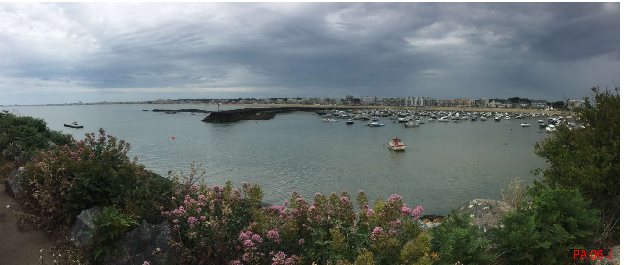
PA 06 J