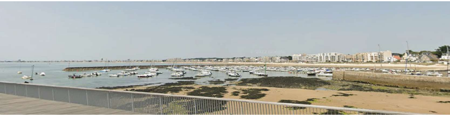
PA 06 I