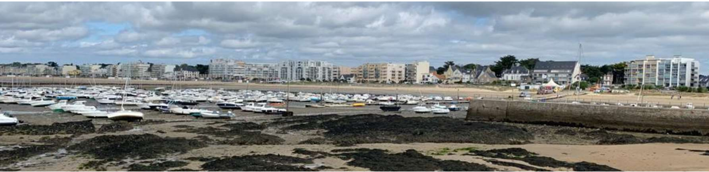
PA 06 K