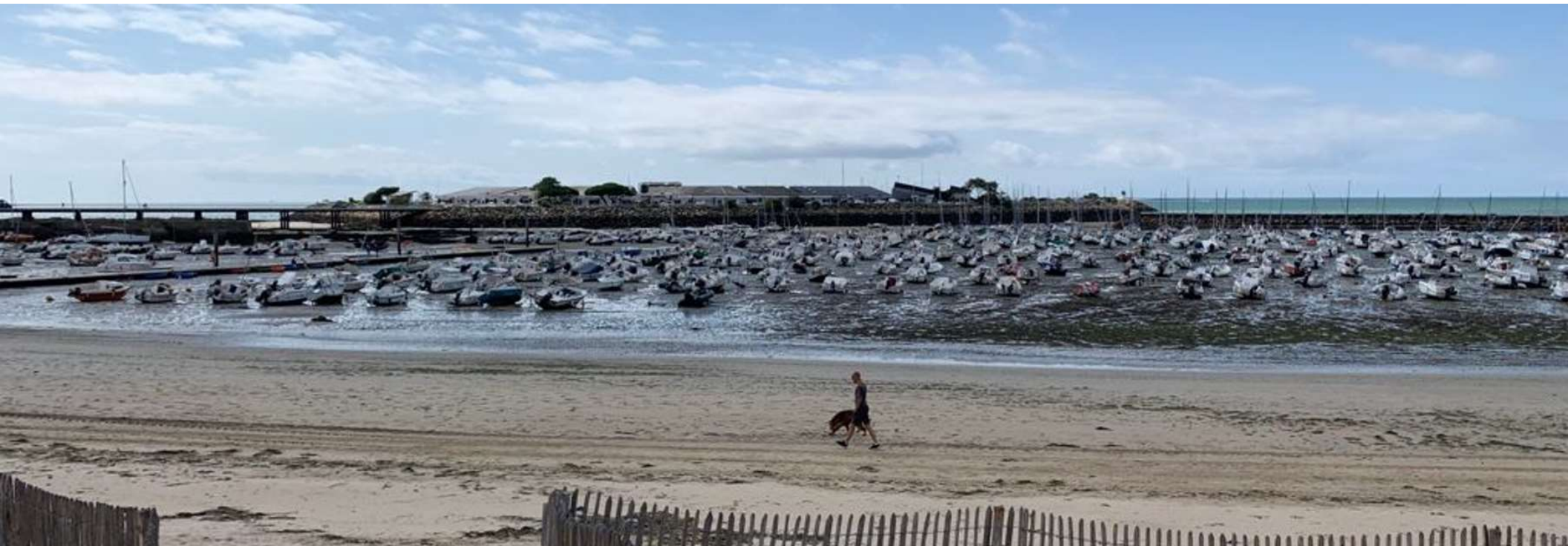
PA 06 L