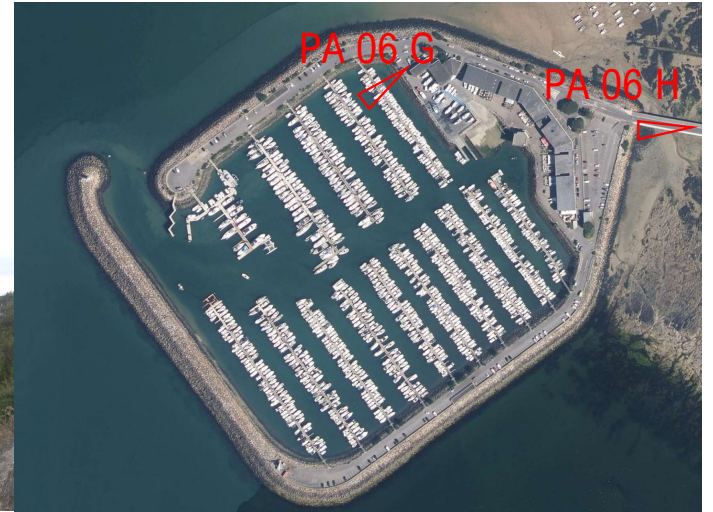
PA 06 G