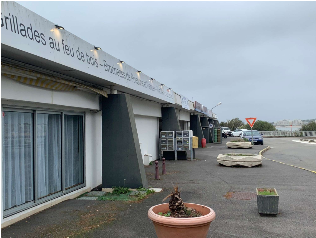
PA 06 E