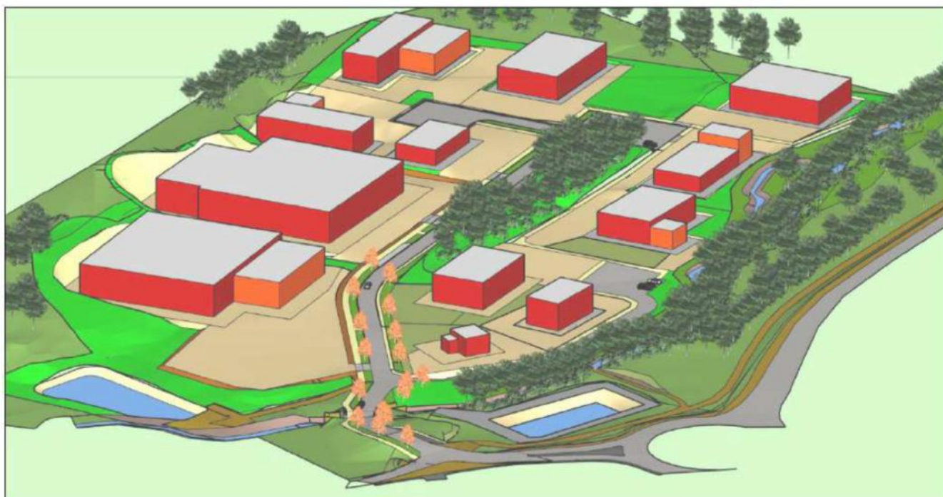
Figure 3: Vue aérienne modélisée du projet de zone d'activités

L'impact paysager du projet est évalué comme « modéré », sans réelle justification.