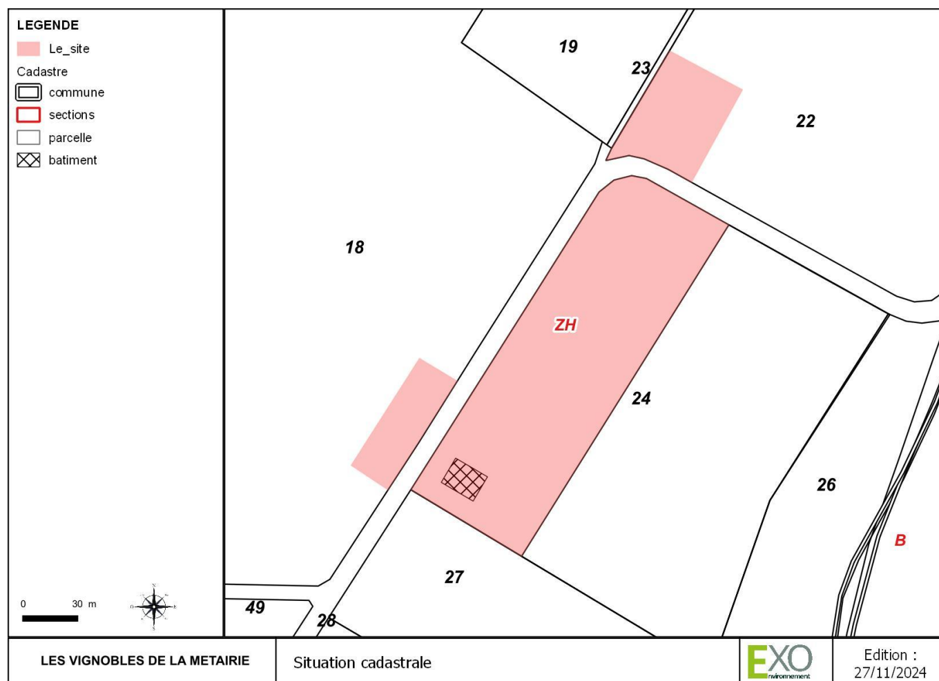
Figure 4. Situation cadastrale et périmètre ICPE