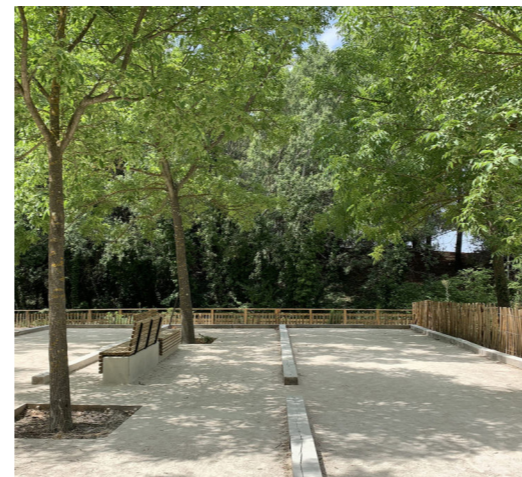
Espace de jeux (pétanque)