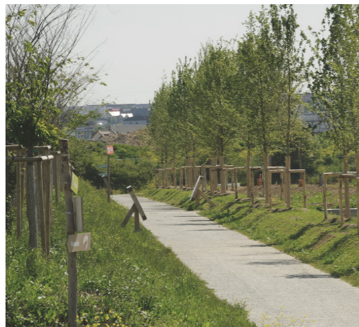
Chemin en creux