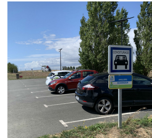
Aire de covoiturage