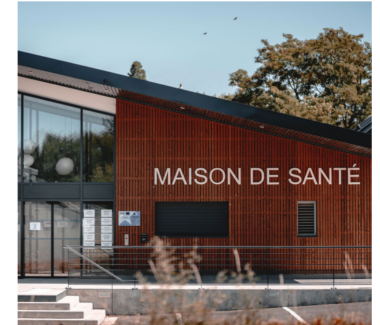
Centre de santé