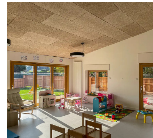
Relais assistantes maternelles