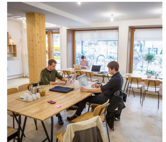
Espace de coworking