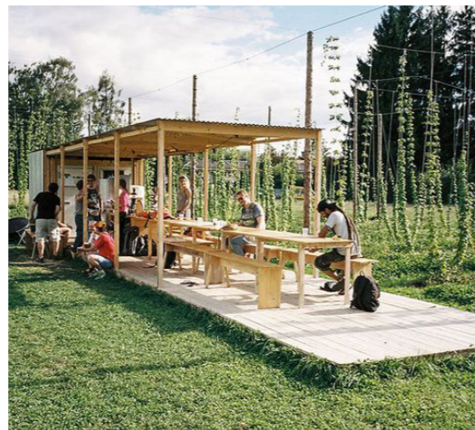
Espace et mobilier de rencontre couvert