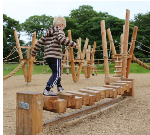
Parcours sportif enfant 1