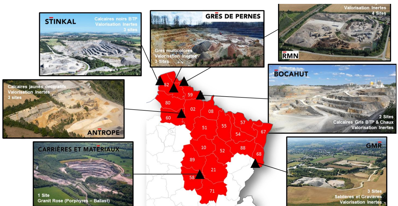
Figure 2. Carrières EIFFAGE ROUTE NORD EST

EIFFAGE ROUTE possédant ses propres gisements au plus près des lieux d'utilisation (chantiers, centrales à béton, centrales d'enrobages, etc.), les carrières de Stinkal bénéficient donc de l'expérience et de l'appui technique et matériel de la division NORD EST d'EIFFAGE ROUTE. La branche « Carrière » gère notamment les sites localisés sur la Figure 2 et listés dans le Tableau 1 ci-après.