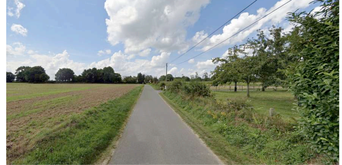
PC 6 Existant