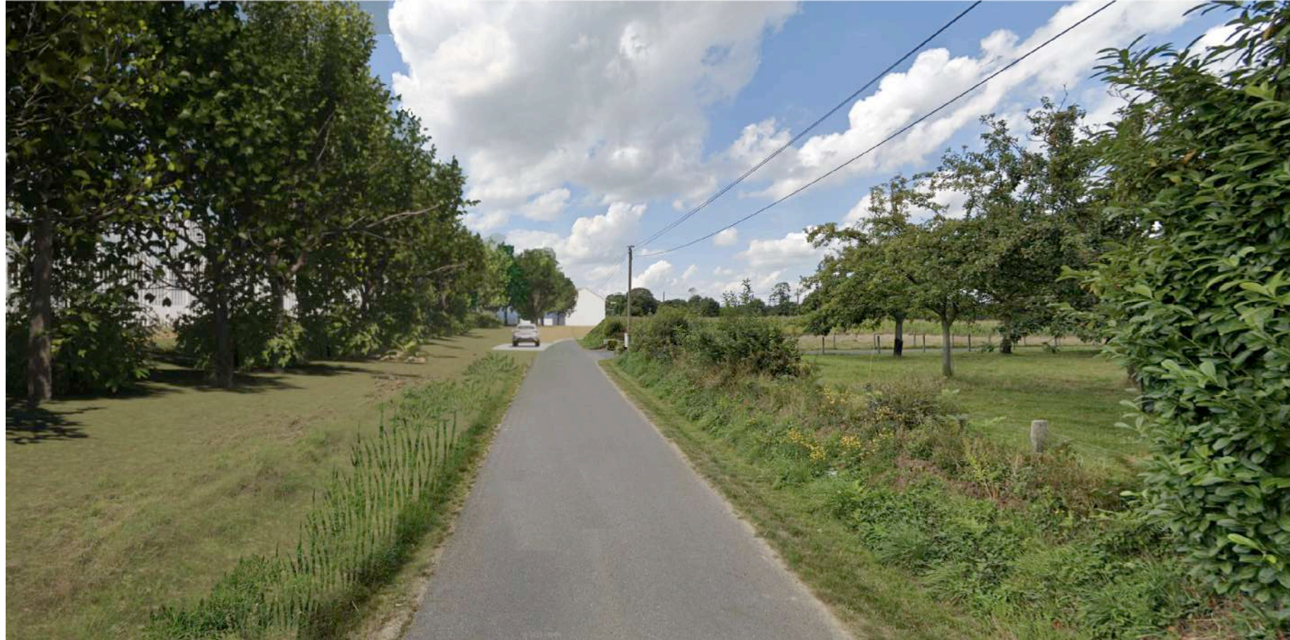
PC 6 Projet