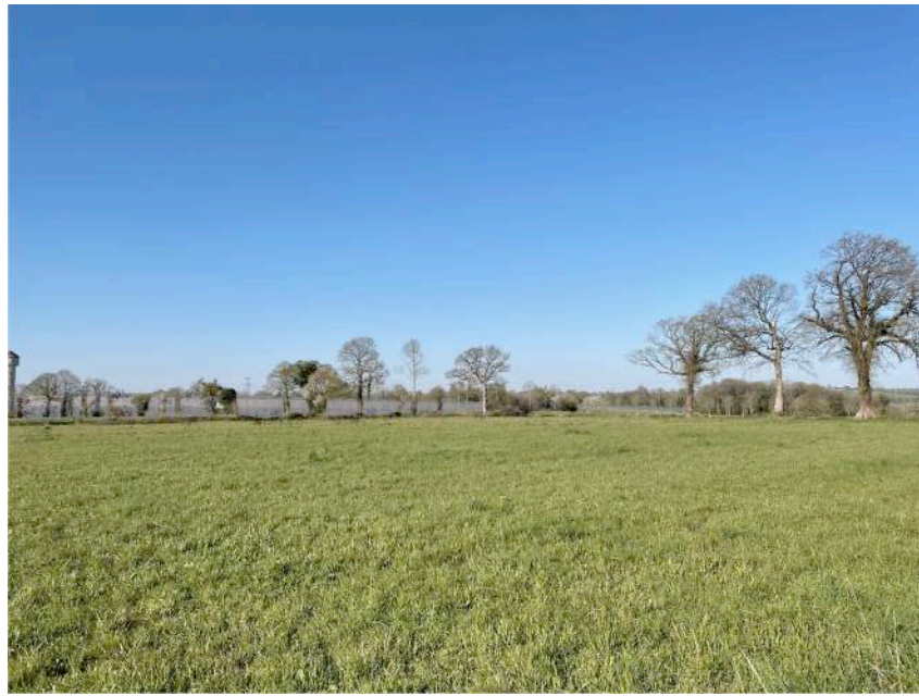
PC 6 Projet d'insertion avec serres seules