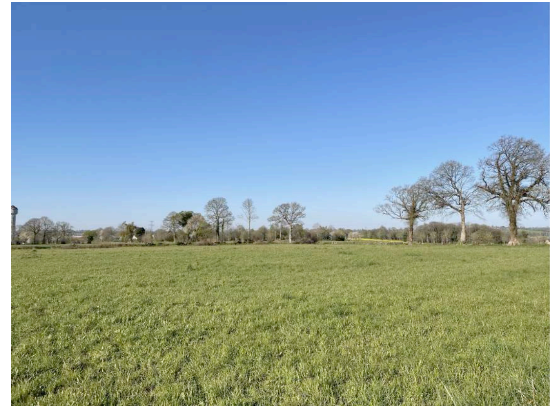
PC 6 Existant