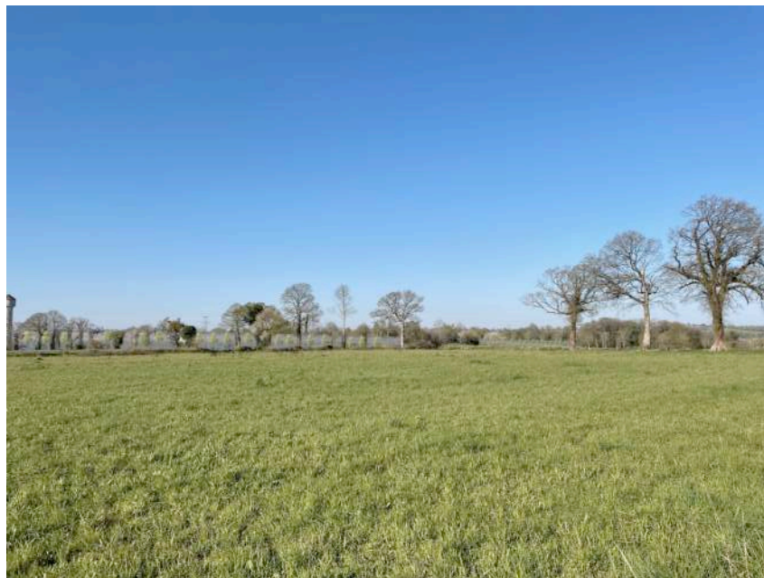
PC 6 Projet d'insertion avec végétation livraison de chantier