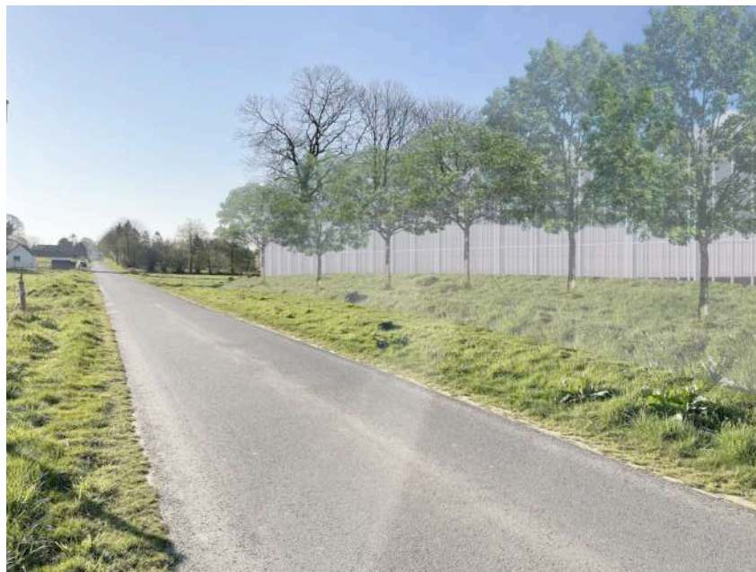
PC 6 Projet d'insertion avec végétation livraison de chantier