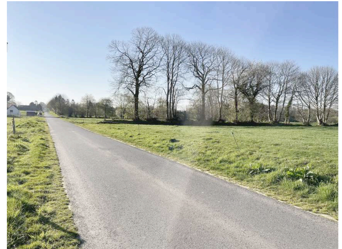
PC 6 Existant