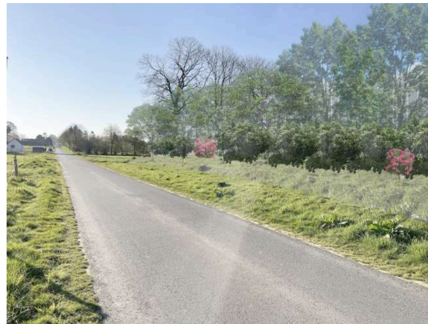
PC 6 Projet d'insertion végétation à maturité