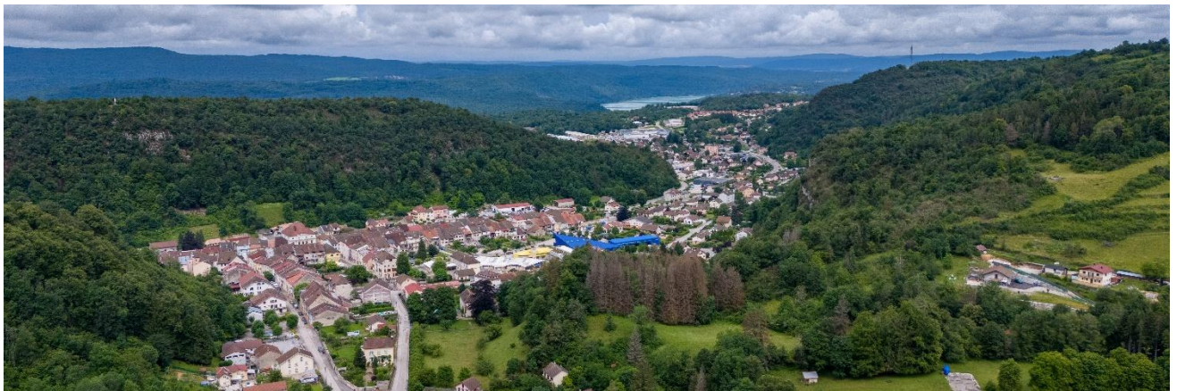
Jura Sud

L'objectif principal du PLUi est de concilier développement urbain et préservation des espaces naturels. En favorisant une urbanisation raisonnée, respectueuse du cadre de vie et des paysages, ce plan entend préserver l'identité et le caractère singulier du territoire de Jura Sud.