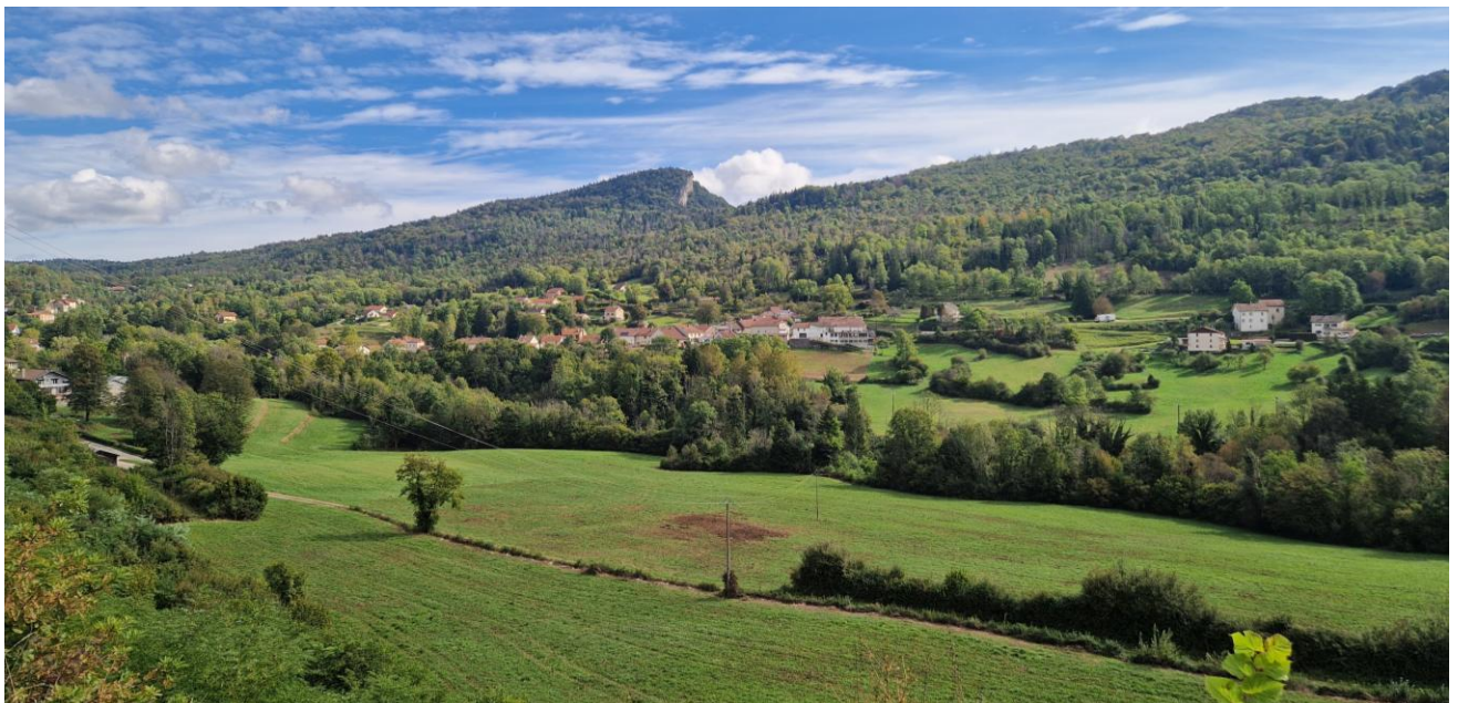
La commune de Villards-d'Héria – Cittànova

A travers ce troisième axe du PADD, Terre d'Émeraude Communauté souhaite à la fois inscrire le territoire de Jura Sud dans le fil conducteur de la nouvelle charte du PNR du Haut-Jura et mettre en œuvre un projet de territoire fédérateur pour l'ensemble des communes en valorisant les singularités du territoire. L'objectif est de préserver la mosaïque de paysages, l'architecture locale, la biodiversité en considérant tous ces éléments comme communs au territoire et en cherchant à faire évoluer les modèles pour plus de résilience.