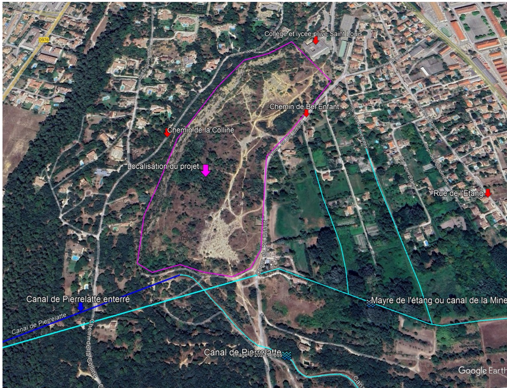
Vue du secteur