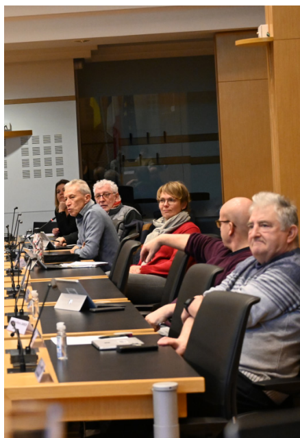
Comité syndical du 31 janvier 2023