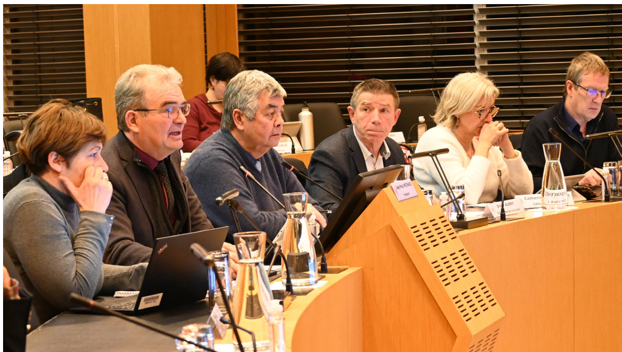
Comité syndical du 31 janvier 2023