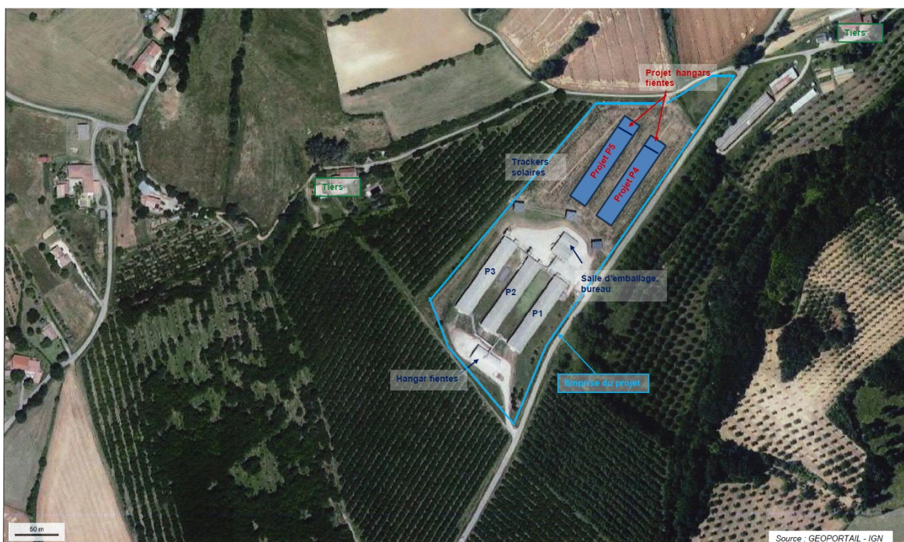
Figure 2 : Plan du projet, les nouveaux bâtiments étant en bleu

Dans les nouveaux bâtiments, les poules sont réparties dans des volières (contrairement aux bâtiments existants où elles sont dans des cages aménagées (qui devraient selon le dossier faire également, ultérieurement, l'objet d'un aménagement en volière). Quels que soient les bâtiments, les poules sont élevées en claustration totale, avec récolte des fientes sur des tapis et des œufs sur des convoyeurs à œufs.