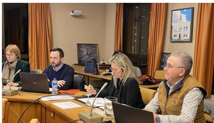
Exemple de présentation du PADD lors des conseils municipaux du Gâvre et de Blain le 6 et 14 décembre 2024 source Ouest France.