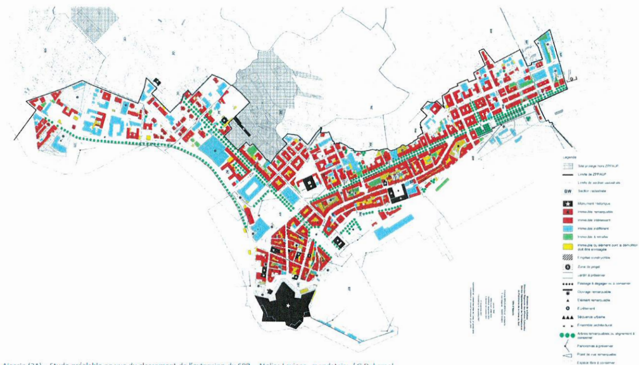
Ajaccio (2A) – Etude préalable en vue du classement de l'extension du SPR – Atelier Lavigne, mandataire / G.Duhamel

Il a donc été décidé par une délibération du 15 février 2023 d'engager la procédure portant sur l'extension du Périmètre du Site Patrimonial Remarquable conformément à la loi LCAP.