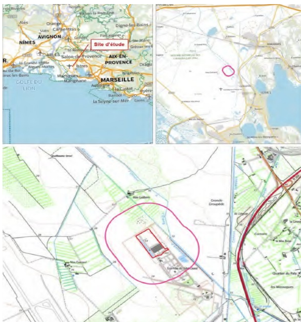
Figure 1: Plan de situation.

Ces installations se situent au lieu-dit « La Grande Groupède » au sein d'un pôle industriel appelé Eco-Pôle du Tubé ouest.