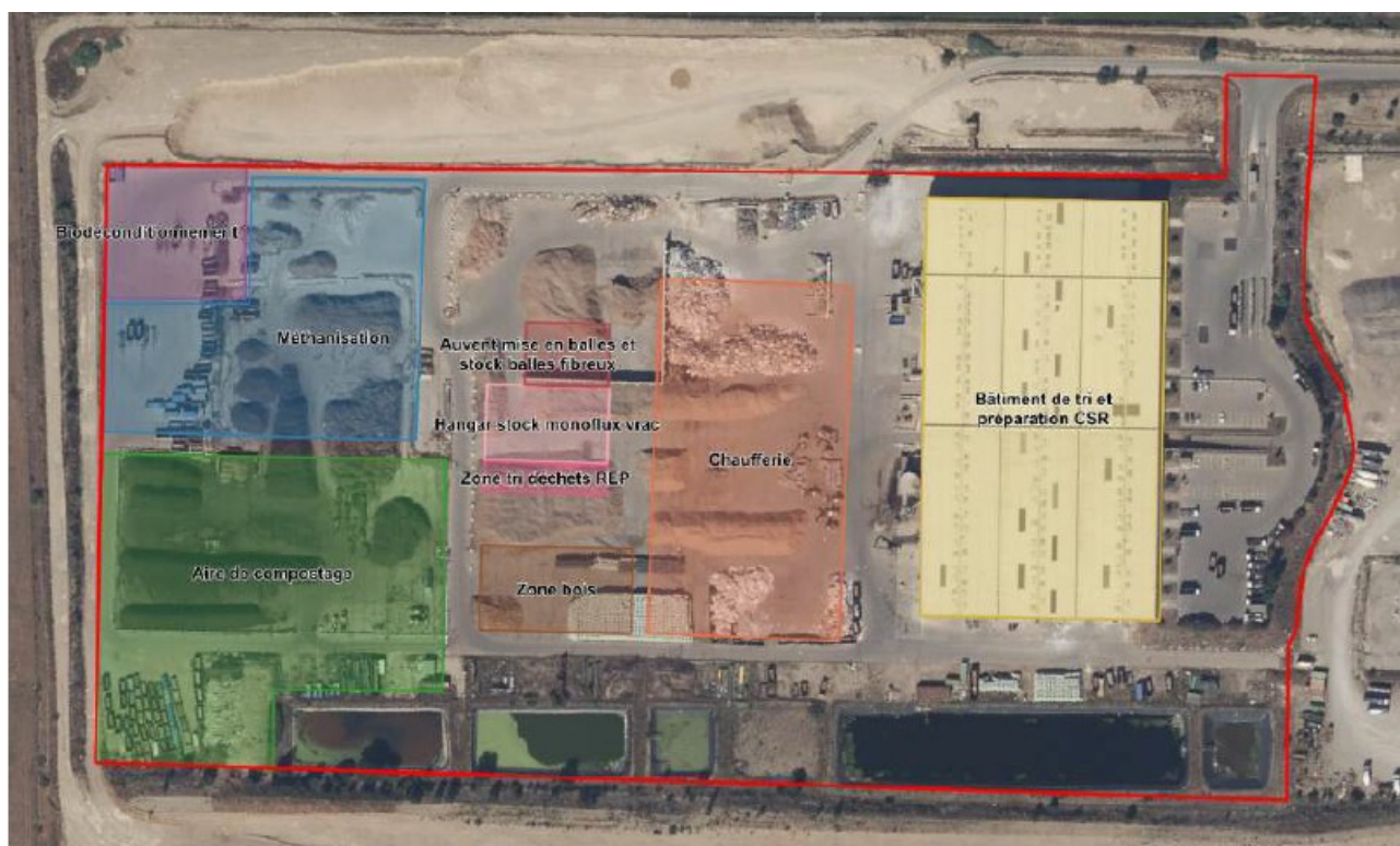
Figure 2: Organisation spatiale du site.

Une plateforme extérieure est également prévue. Elle regroupe une aire de compostage d'une capacité de 25 000 t/an de biodéchets et de boues de station d'épuration 2 , un bâtiment de bio conditionnement et de préparation de biodéchets, une installation de méthanisation et de valorisation énergétique à