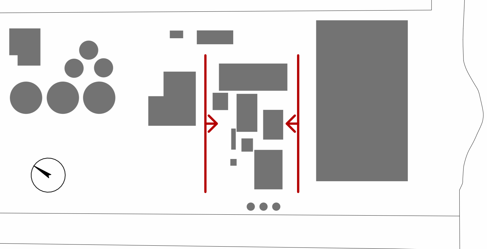
REPÉRAGE DES ÉLÉVATIONS ET TOITURES