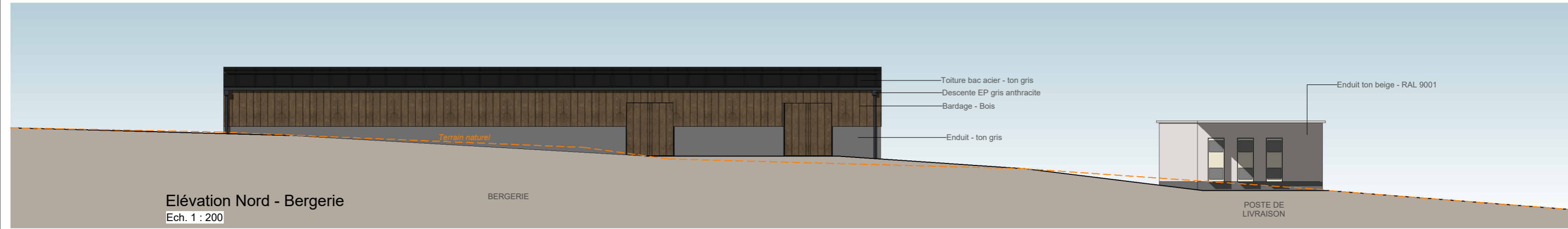
Elévation Nord - Bergerie Ech. 1 : 200