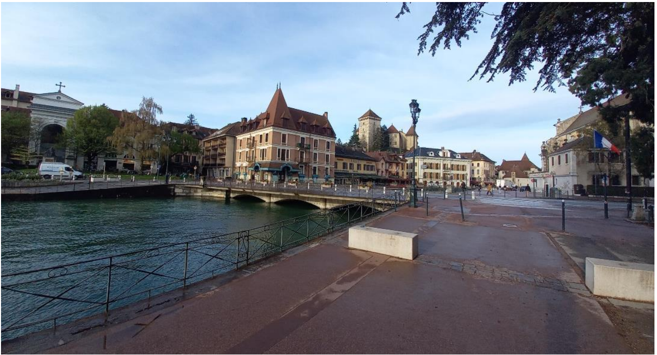
5 – Vue de l'extrémité du Quai Napoléon du Canal du Thiou (vue vers l'Ouest/Sud-Ouest)