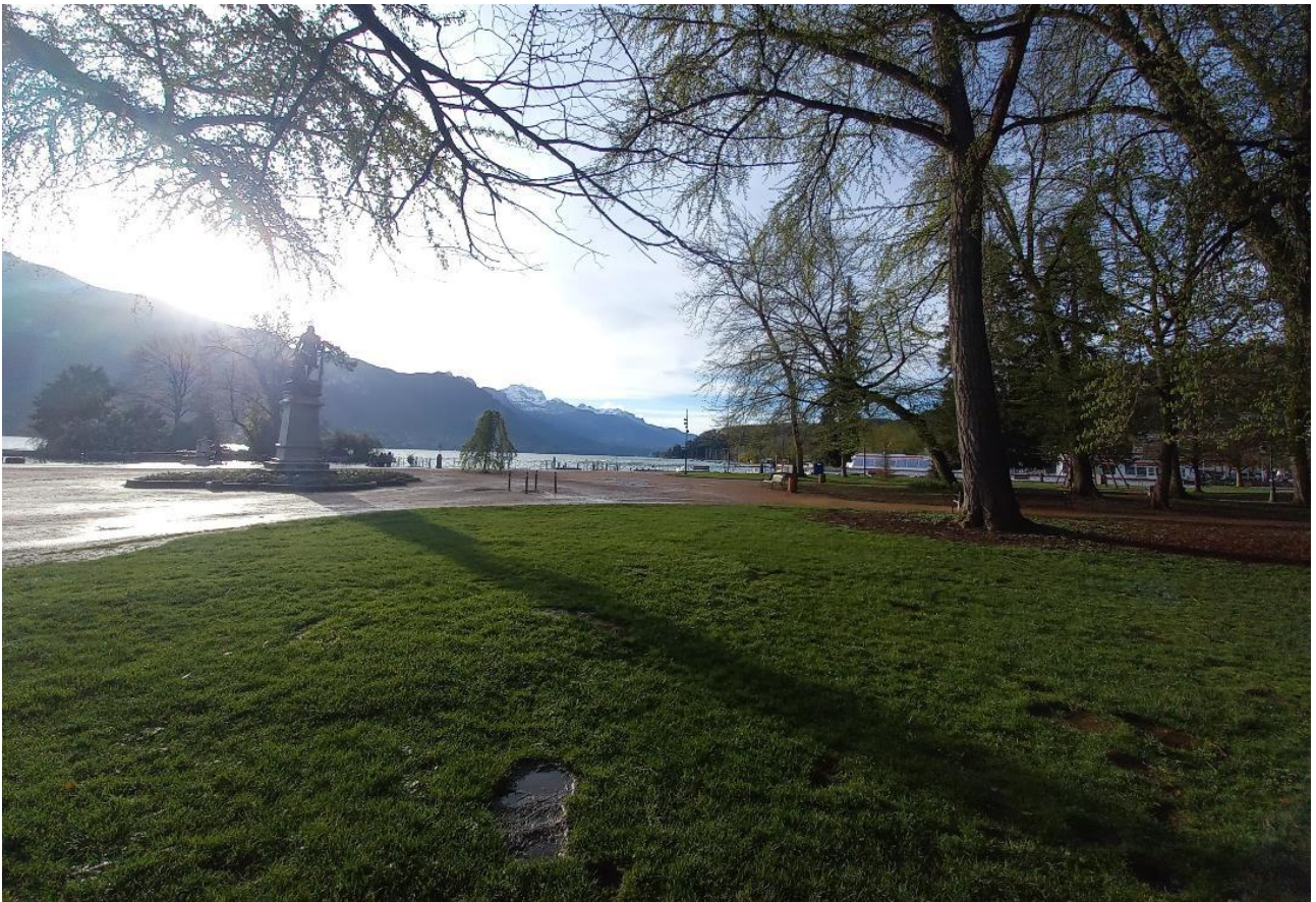
3 – Vue d’une zone potentielle d’implantation de forage de captage en nappe (vue vers le Sud-Est)