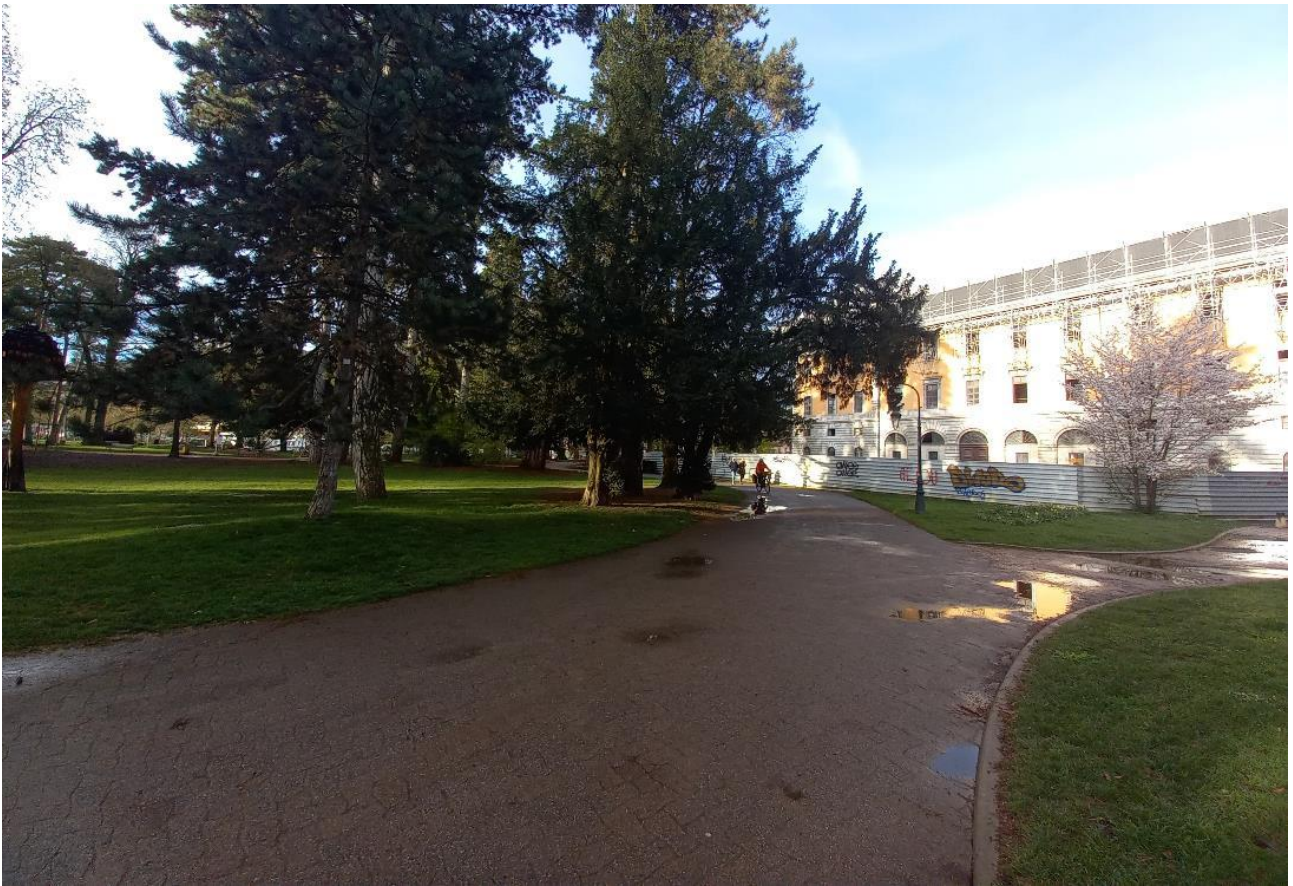
1 – Vue de l'Hôtel de Ville depuis les Jardins de l'Europe (vue vers le Sud-Ouest)