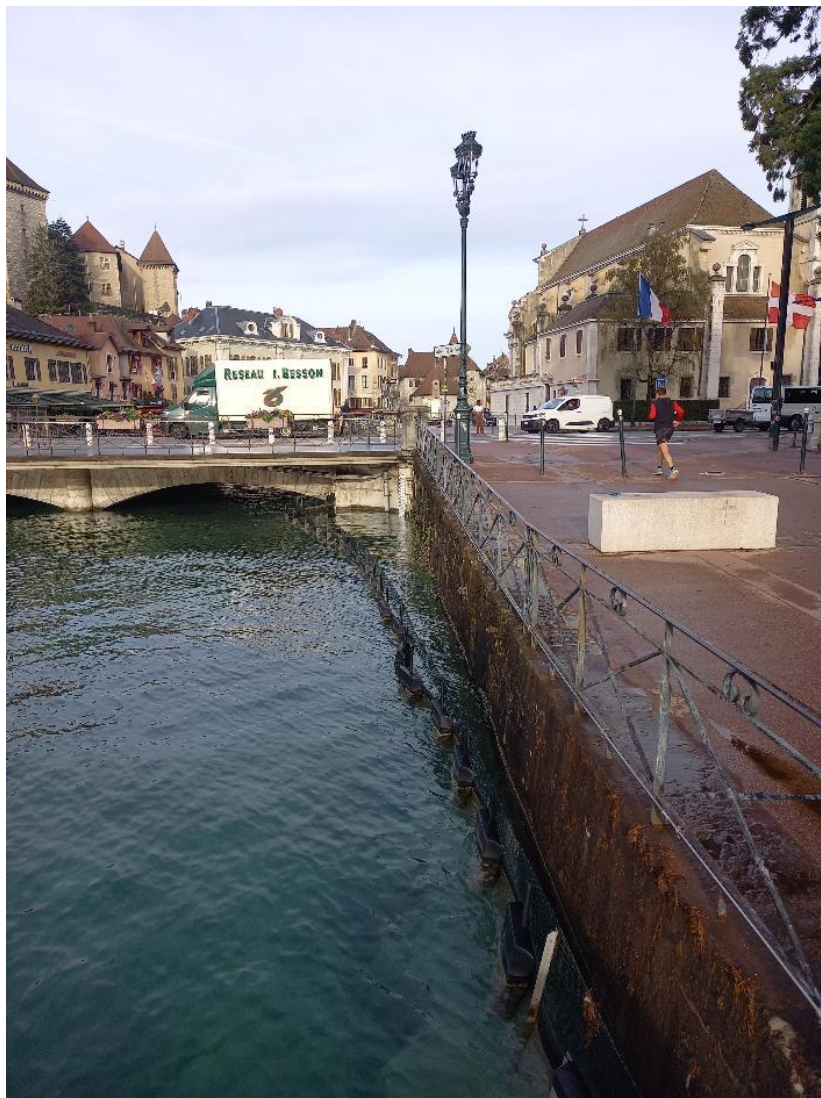
6 – Vue de l'extrémité du Quai Napoléon du Canal du Thiou au niveau du point de rejet envisagé (vue vers l'Ouest)