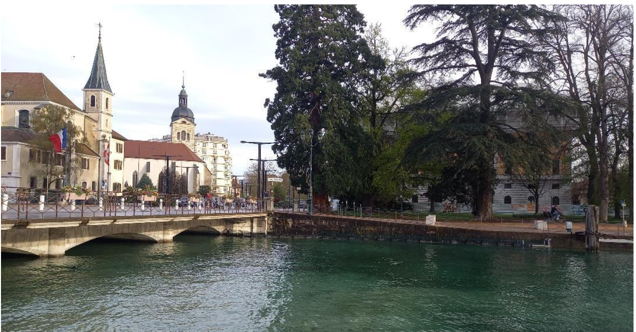
8 – Vue du Quai Napoléon du Canal du Thiou depuis le Quai de la Tournette (vue vers le Nord/Nord-Est)