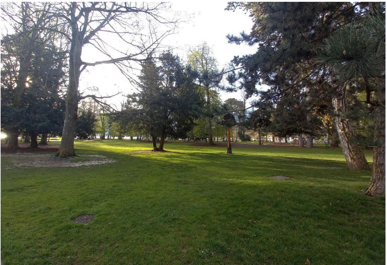
2 – Vue d'une zone potentielle d'implantation de forage de captage en nappe (vue vers le Sud)