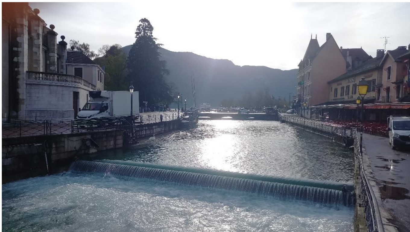
9 – Vue du Canal du Thiou et du seuil en amont du Pont Perrière (vue vers l'Est, Pont de la Halle en arrière-plan)