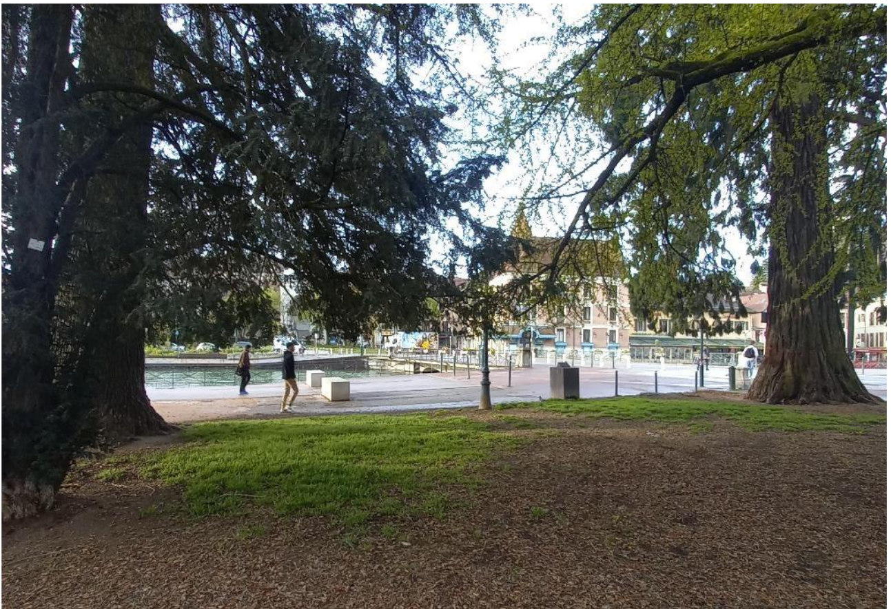
4 – Vue depuis les Jardins de l’Europe vers le Quai Napoléon du Canal du Thiou (vue vers le Sud)