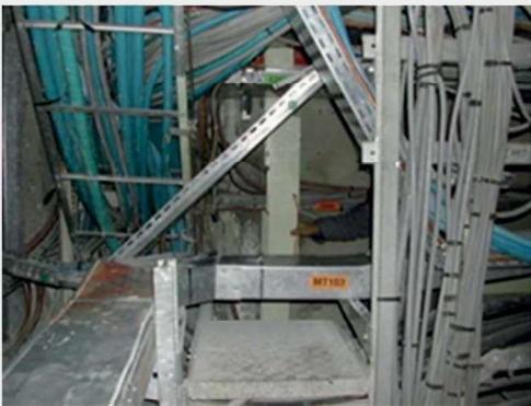
Ajout de supports pour les chemins de câble

À la suite de l'accident de la centrale nucléaire de Fukushima-Daiichi (2011), un aléa sismique Noyau Dur (SND) a été défini ; il est enveloppe du Séisme majoré de sûreté de site (SMS) majoré de 50 % et des séismes d'une période de retour de 20 000 ans (évalués de manière probabiliste).