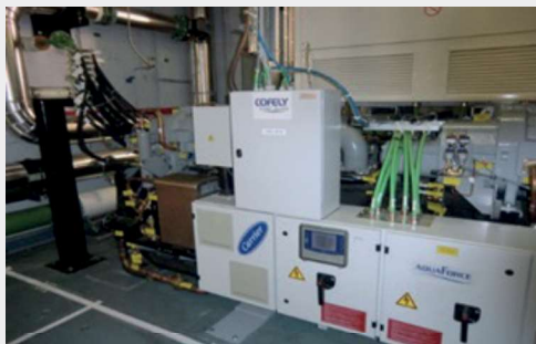
Nouveau groupe froid (+ 50% de capacité frigorifique)