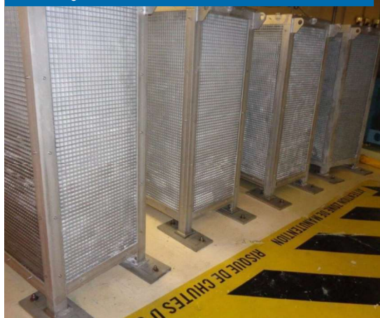
Paniers de tétraborate de disodium décahydraté

Ces paniers sont représentés sur la photo ci-contre. Leur emplacement dans le bâtiment réacteur est illustré en page 23.