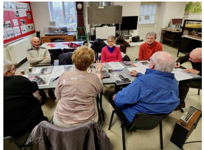
Les ateliers se déroulent dans une ambiance conviviale.

Ces ateliers d'écriture se dérouleront en petit groupe de huit à dix personnes. « L'idée est que ces volontaires veuillent bien transmettre une part de leur mémoire, partager une émotion, un événe-