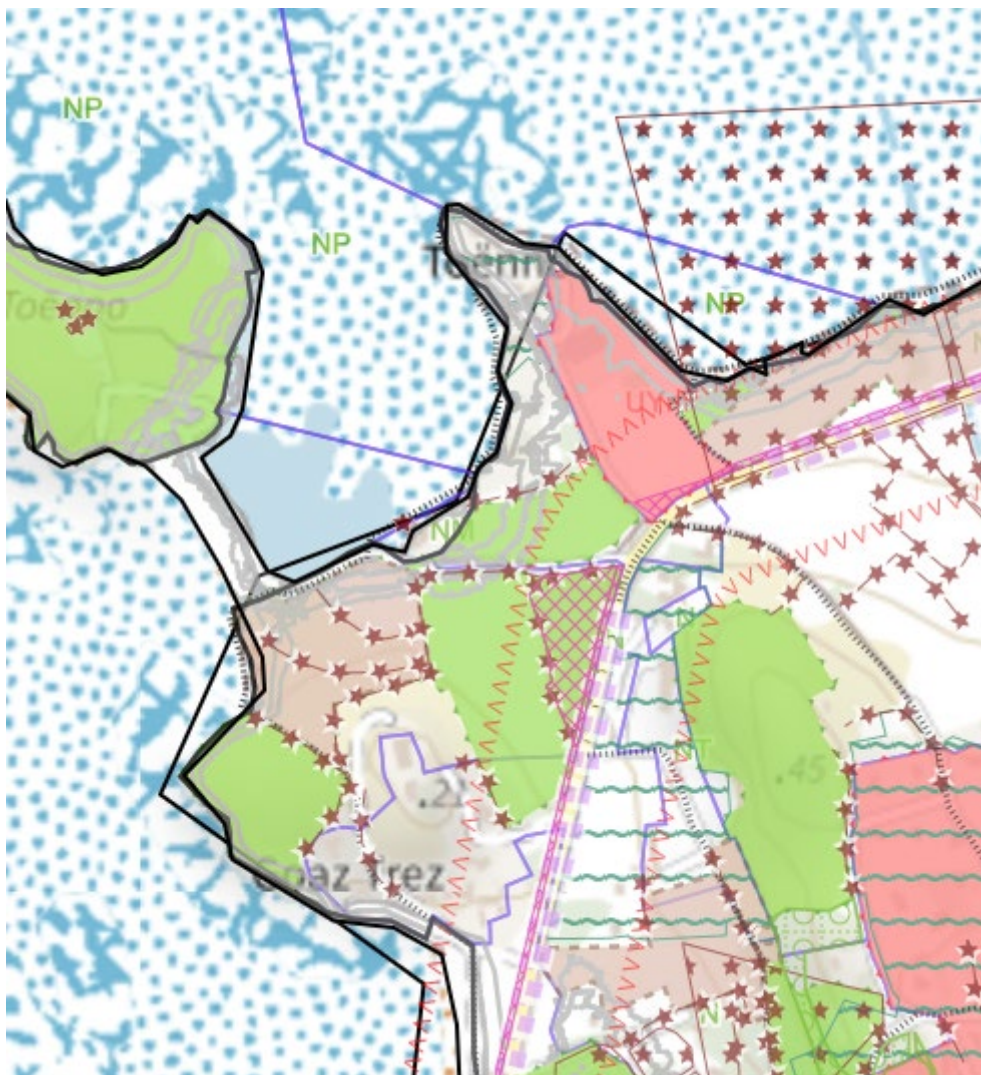
PLU 2017 document 2019

Pour finir, l'opération réservée 22343-27 qui doit aboutir à la création d'un parking est bienvenue, seule création possible hors zone des 100m et qui doit être jumelée avec l'interdiction de circulation et stationnement touristique sur le DPM.