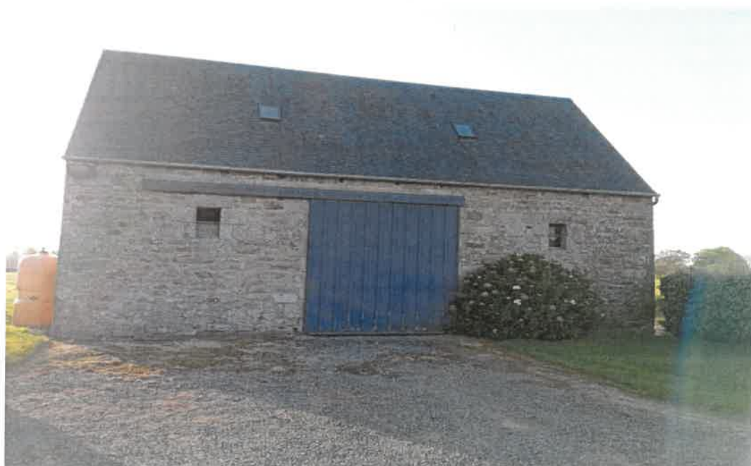
Vue de la façade Ouest du bâtiment