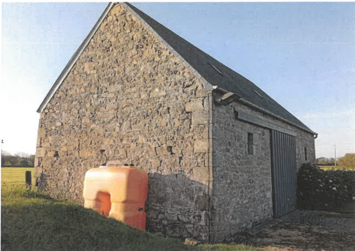
Vue la façade Ouest du bâtiment et du pignon Nord