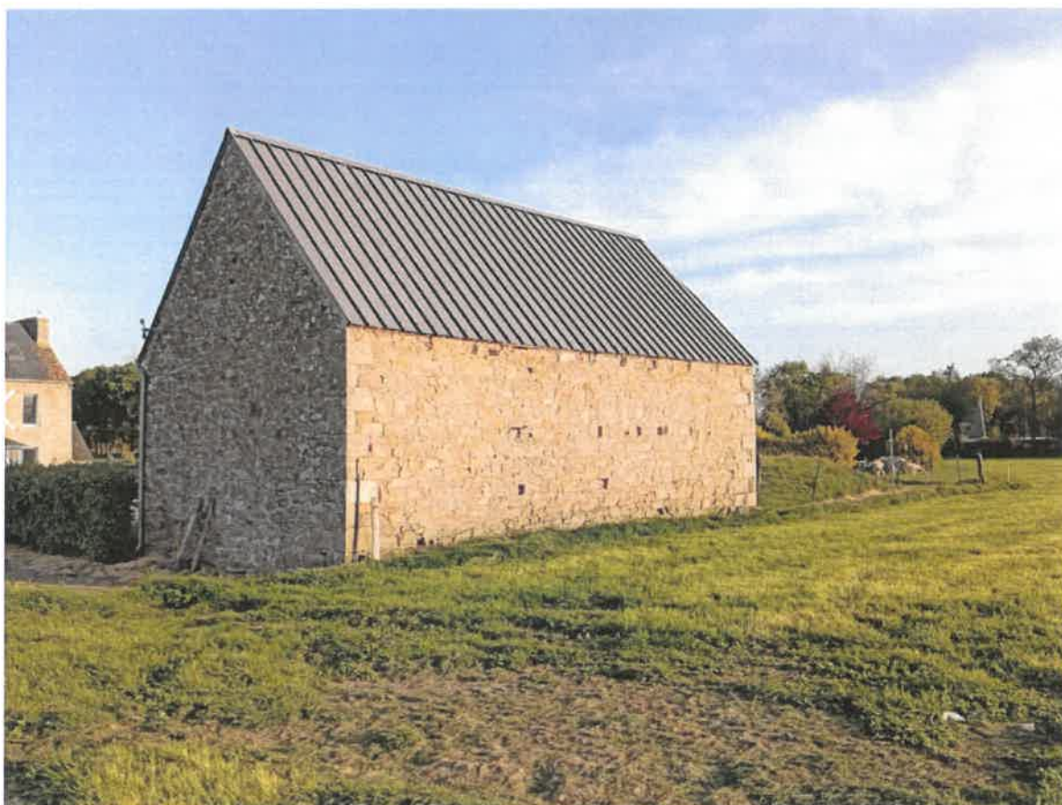
Vue de l'arrière Est du bâtiment et du pignon Sud