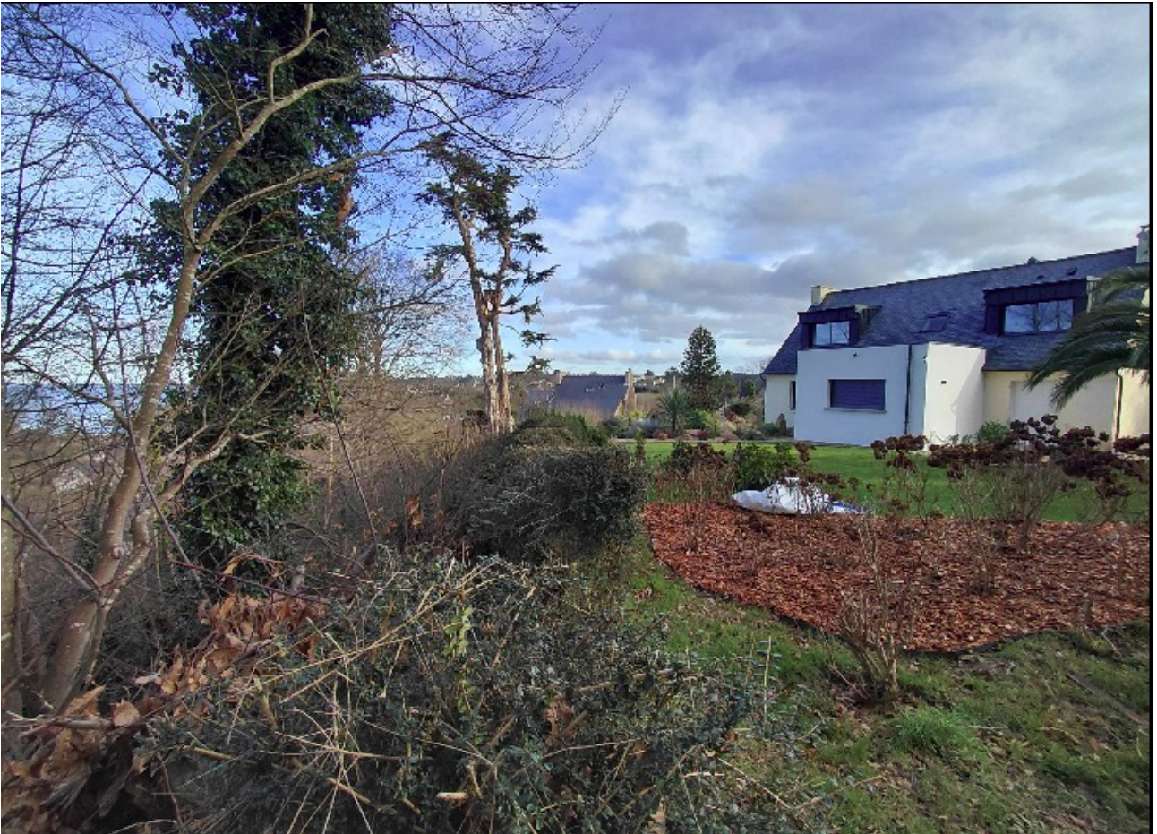
extension arrière BA62

- La représentation des parcelles 62 et 63 incorrecte : 2 extensions sur la 62 et 1 sur la 63 (cf vue aérienne)