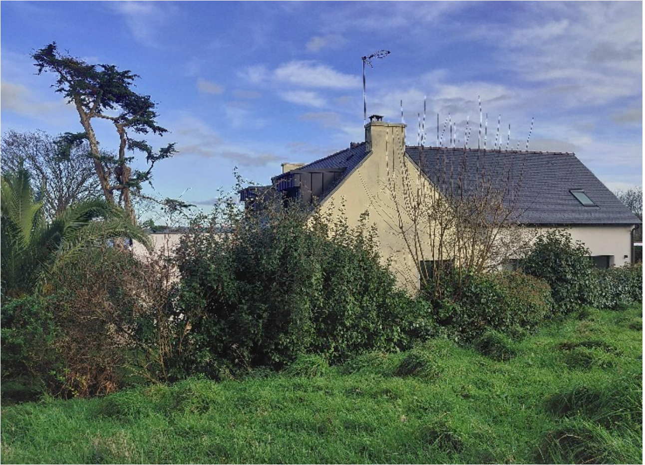
Extension latérale BA62