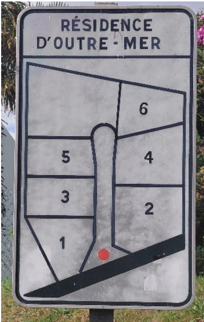
Panneau d'indication de la configuration du lotissement en début d'impasse.