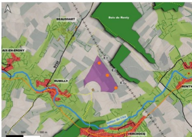
Carte de présentation du projet (étude d'impact - page 148)

L'avis est rendu sur un projet de trois éoliennes d'une hauteur maximale de 164,5 mètres et de garde au sol 1 d'au moins 33,5 mètres, localisées comme indiqué ci-dessous.