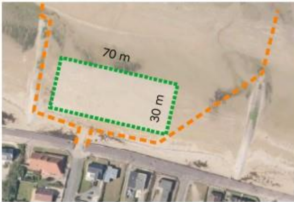
Aire de stationnement au droit de la cale de la Caline