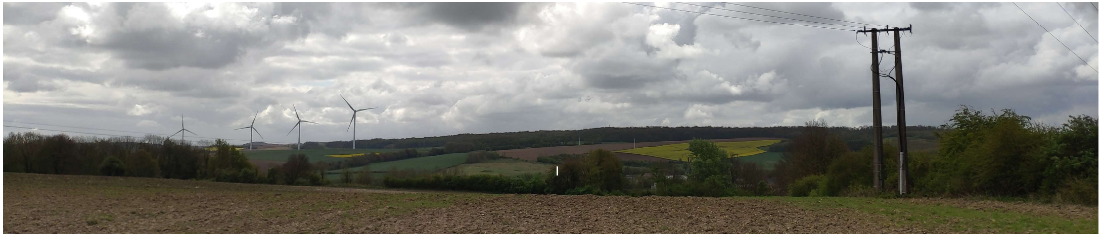
Point de vue 3 - Photographie depuis la Rue du Moulin au nord du projet et en direction du sud.