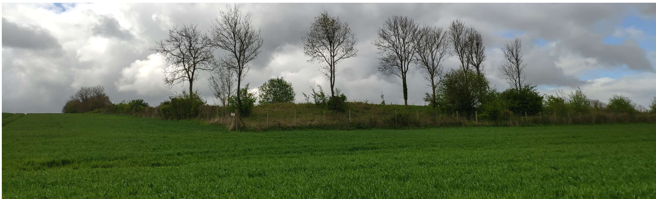
Point de vue 2 - Photographie depuis le chemin rural situé au nord-est du projet et en direction du sud-ouest.