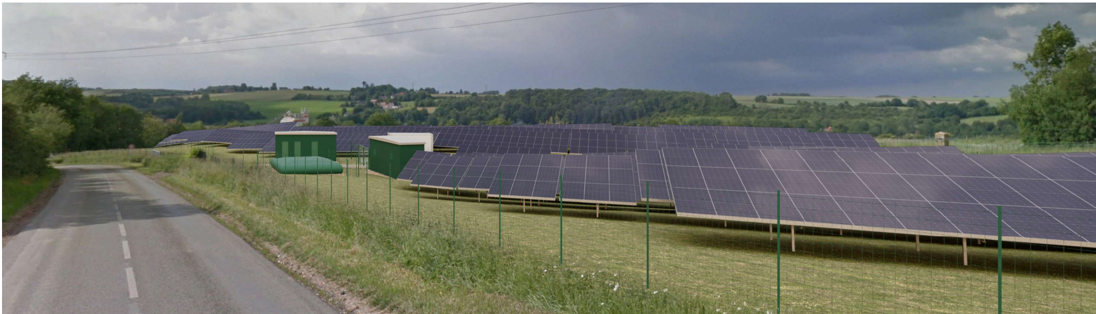
Point de vue 1 - Photomontage depuis la Route départementale N°86 situé au sud du projet et en direction nord - Sans mesures paysagères