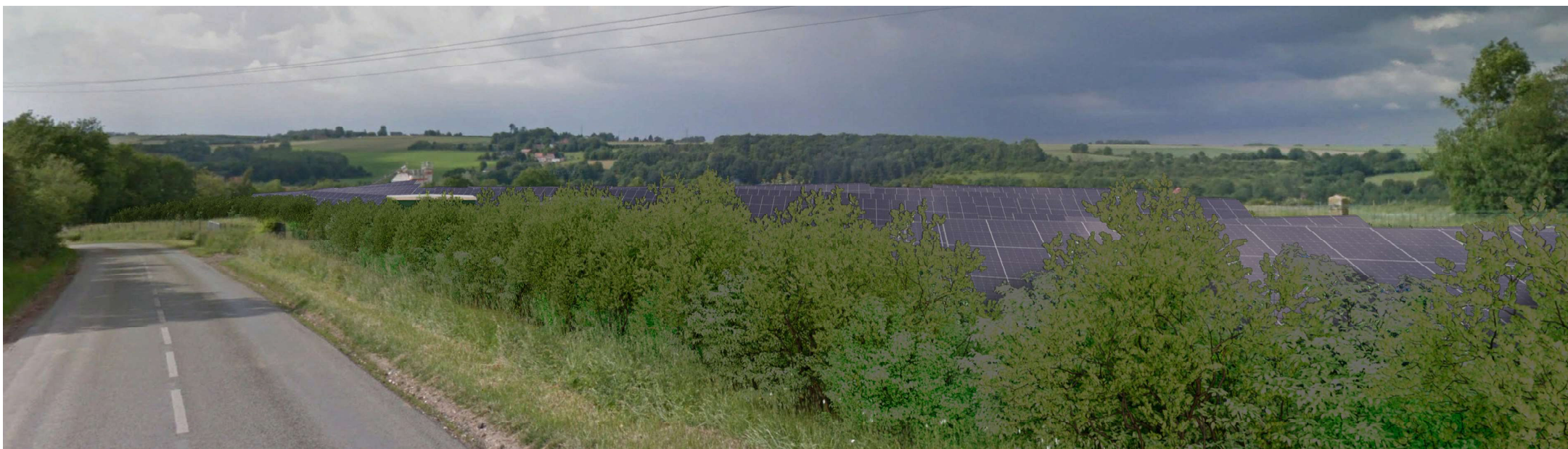
Point de vue 1- Photomontage depuis la Route départementale N°86 situé au sud du projet et en direction nord - Avec mesures paysagères