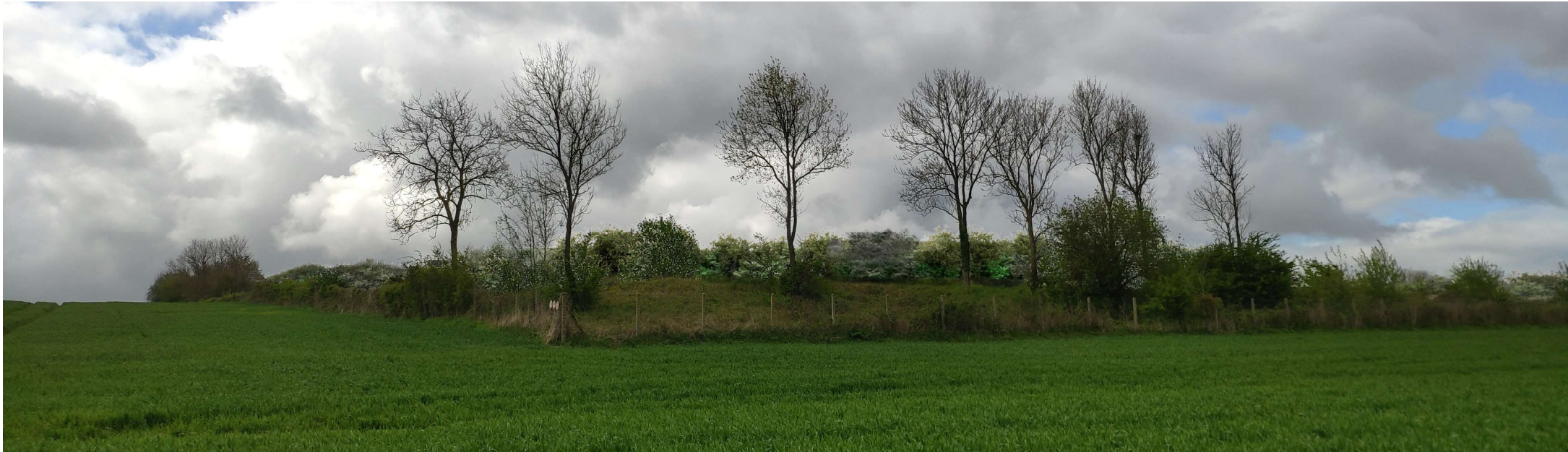
Point de vue 2- Photomontage depuis le chemin rural situé au nord-est du projet et en direction du sud-ouest- Avec mesures paysagères.