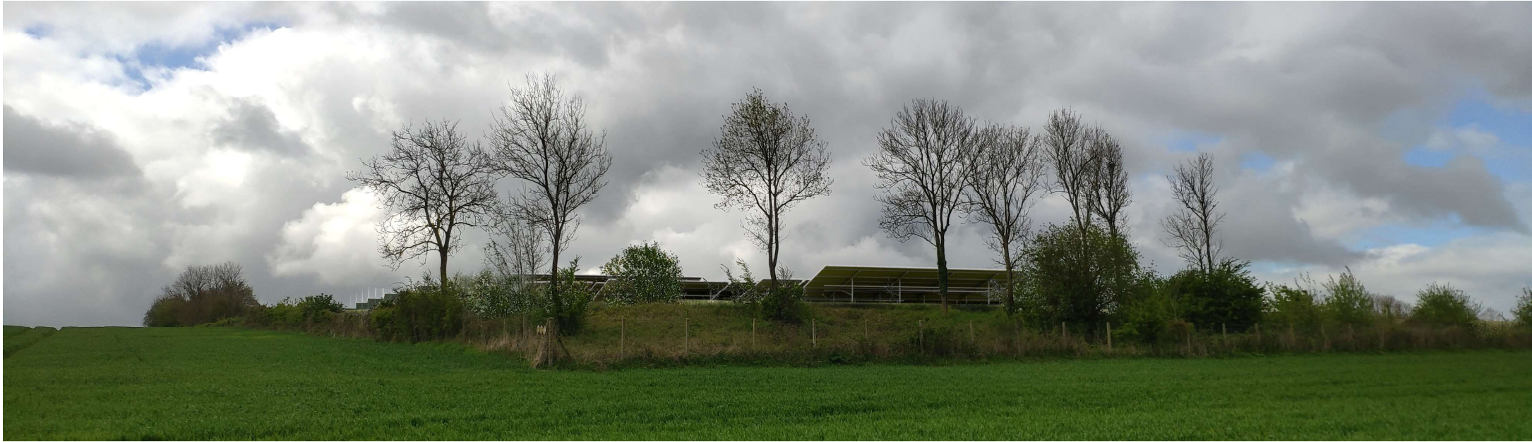
Point de vue 2- Photomontage depuis le chemin rural situé au nord-est du projet et en direction du sud-ouest - Sans mesures paysagères.