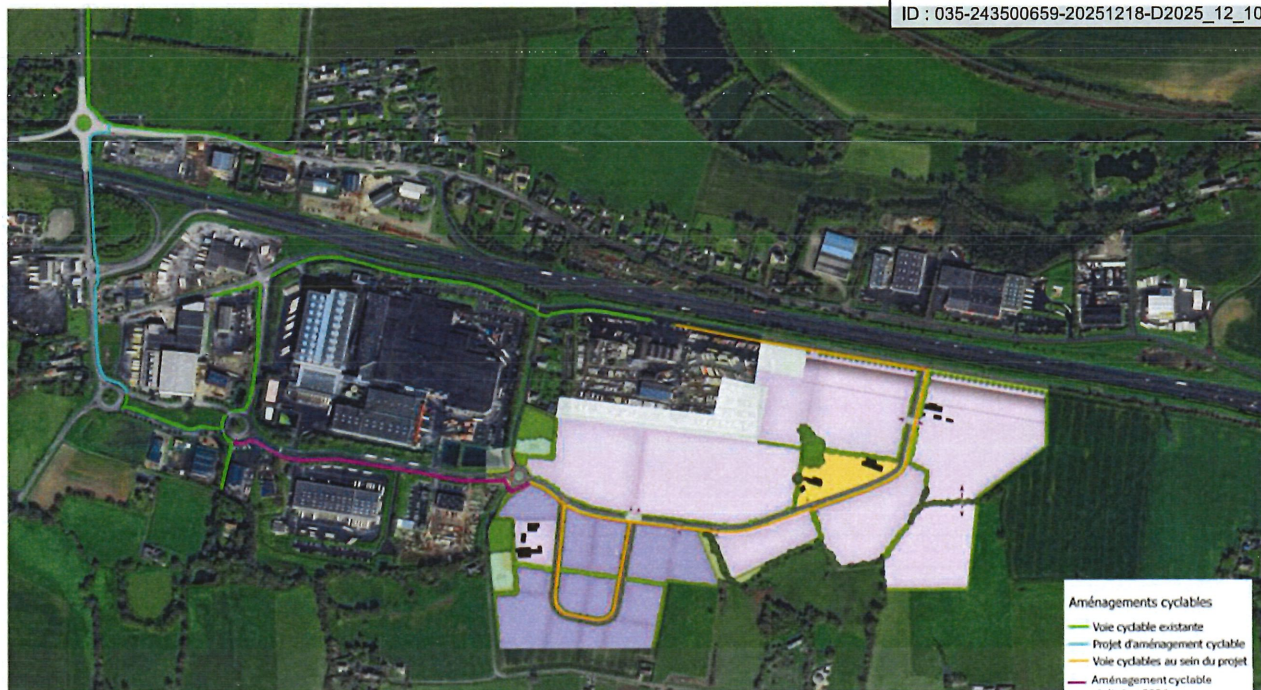
Illustration : Plan des aménagements cyclables existants et en projets aux abords du projet

Dans le cadre de l'élaboration du dossier de réalisation de la ZAC, le PAYS DE CHÂTEAUGIRON COMMUNAUTÉ partagera avec la Ville de Châteaubourg les plans de réaménagement de la route des Barres et du giratoire.