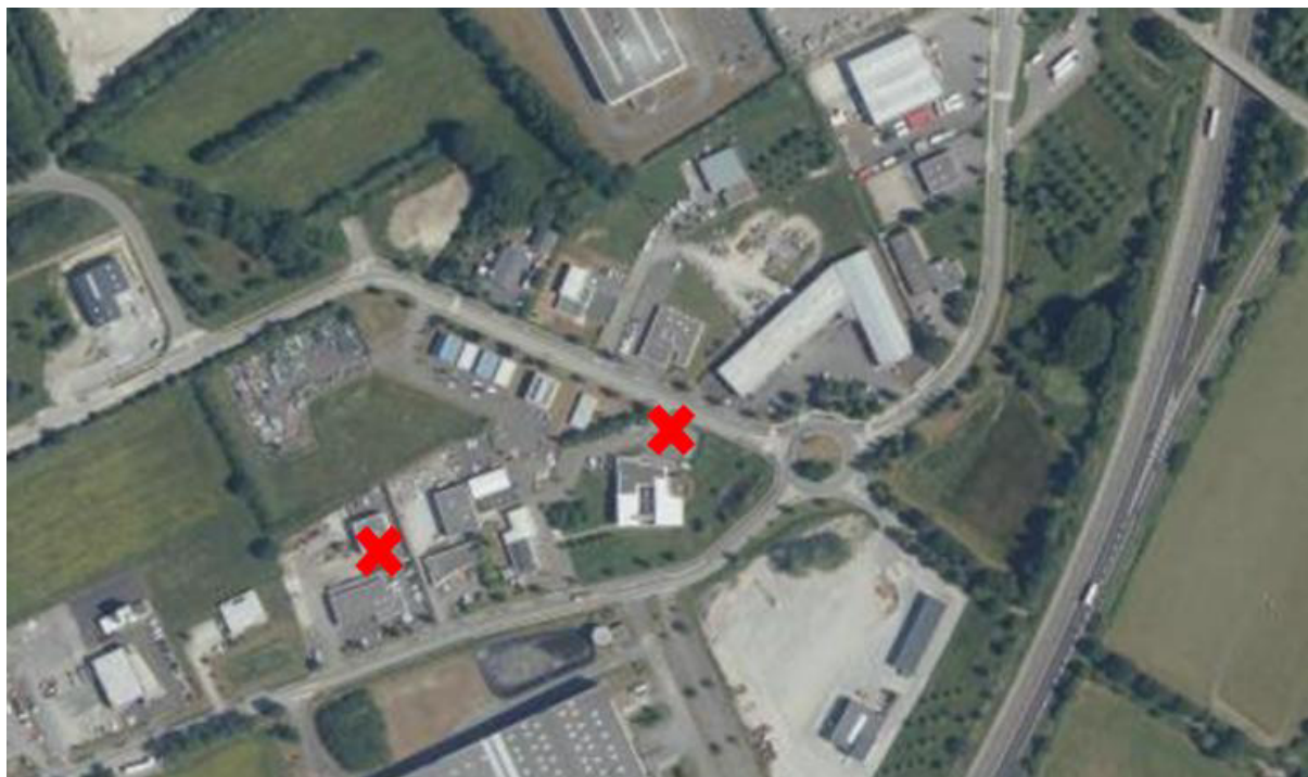
Site du siège de la CCEG (Parc Erette Grand'Haie)