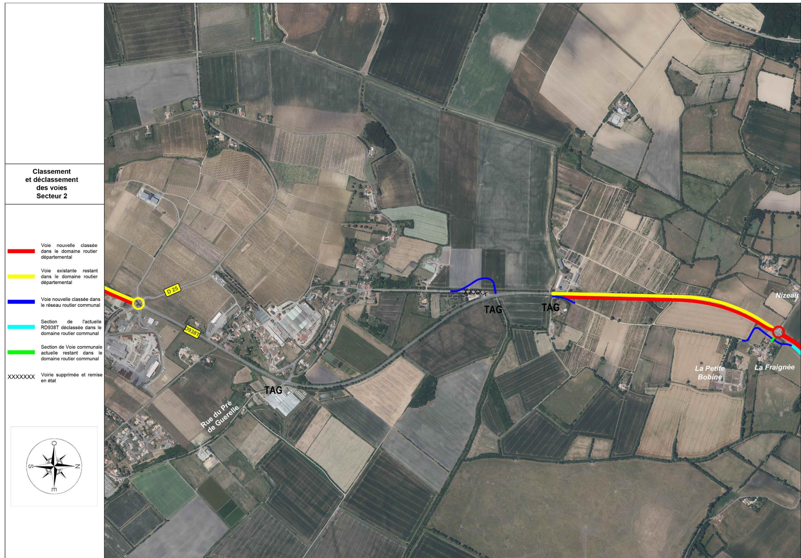
Figure 2 : Classement et déclassement des voies sur le secteur 2