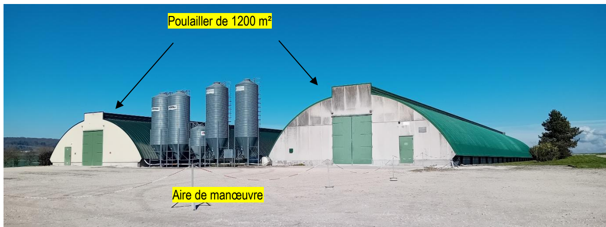
Vue des poulaillers existants