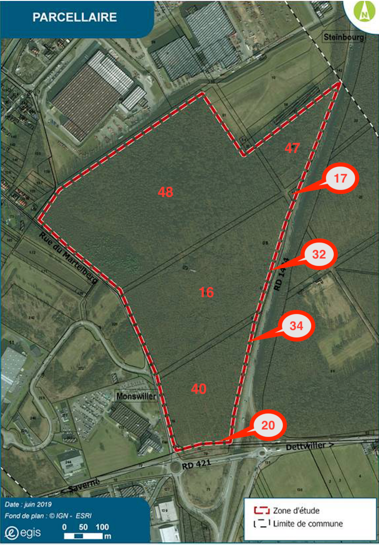
FIGURE 4 : LOCALISATION DU SITE DE PROJET ET NUMEROS DE CADASTRE