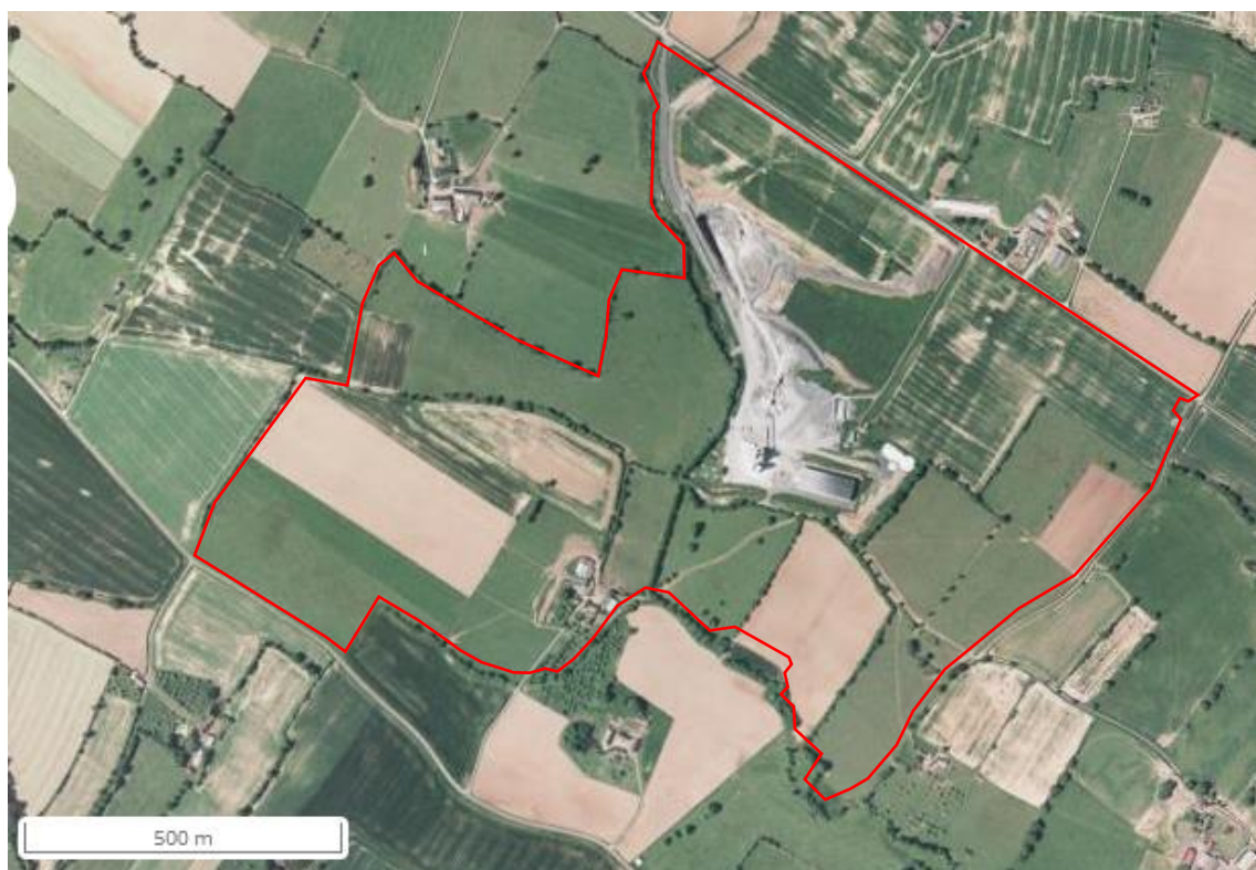
Fig. 110 : Photographie aérienne du secteur datée de la période 2000-2005