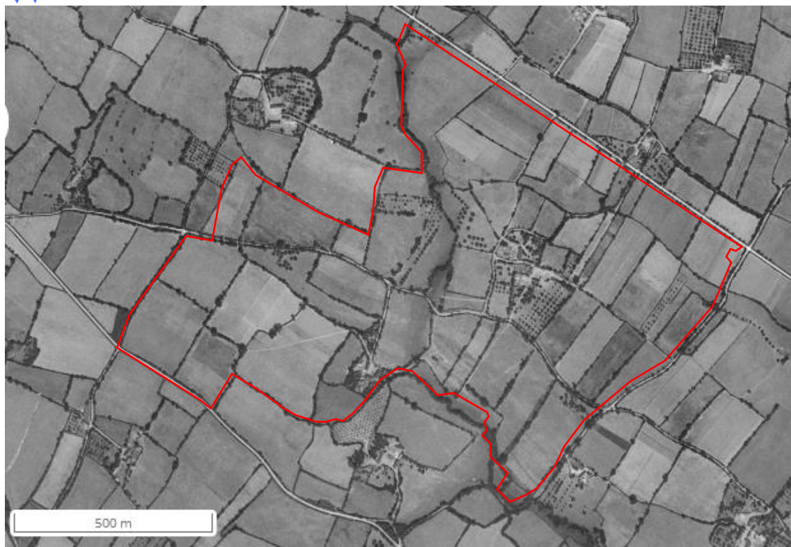
Fig. 109 : Photographie aérienne du secteur datée de la période 1950-1965