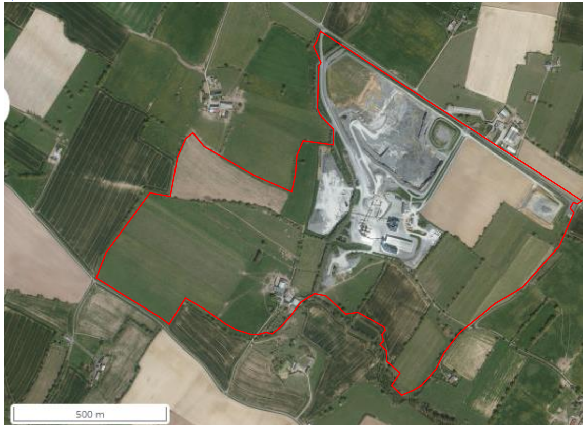
Fig. 111 : Photographie aérienne du secteur datée de la période 2006-2010

Les mesures de limitation des risques de pollution des sols sur le site sont identiques à celles prises pour limiter les risques de pollutions des eaux, aspect développé au chapitre 9.4.4, auquel on se reportera.