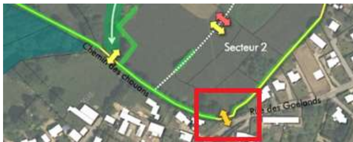
Etude d'impact page 12 accès motorisé secondaire possible en orange - volontairement encadré en rouge)

Concernant la question des circulations de véhicules depuis et vers la ZAC, certains documents font état d'un accès motorisé au Sud par la rue des Goëlands :