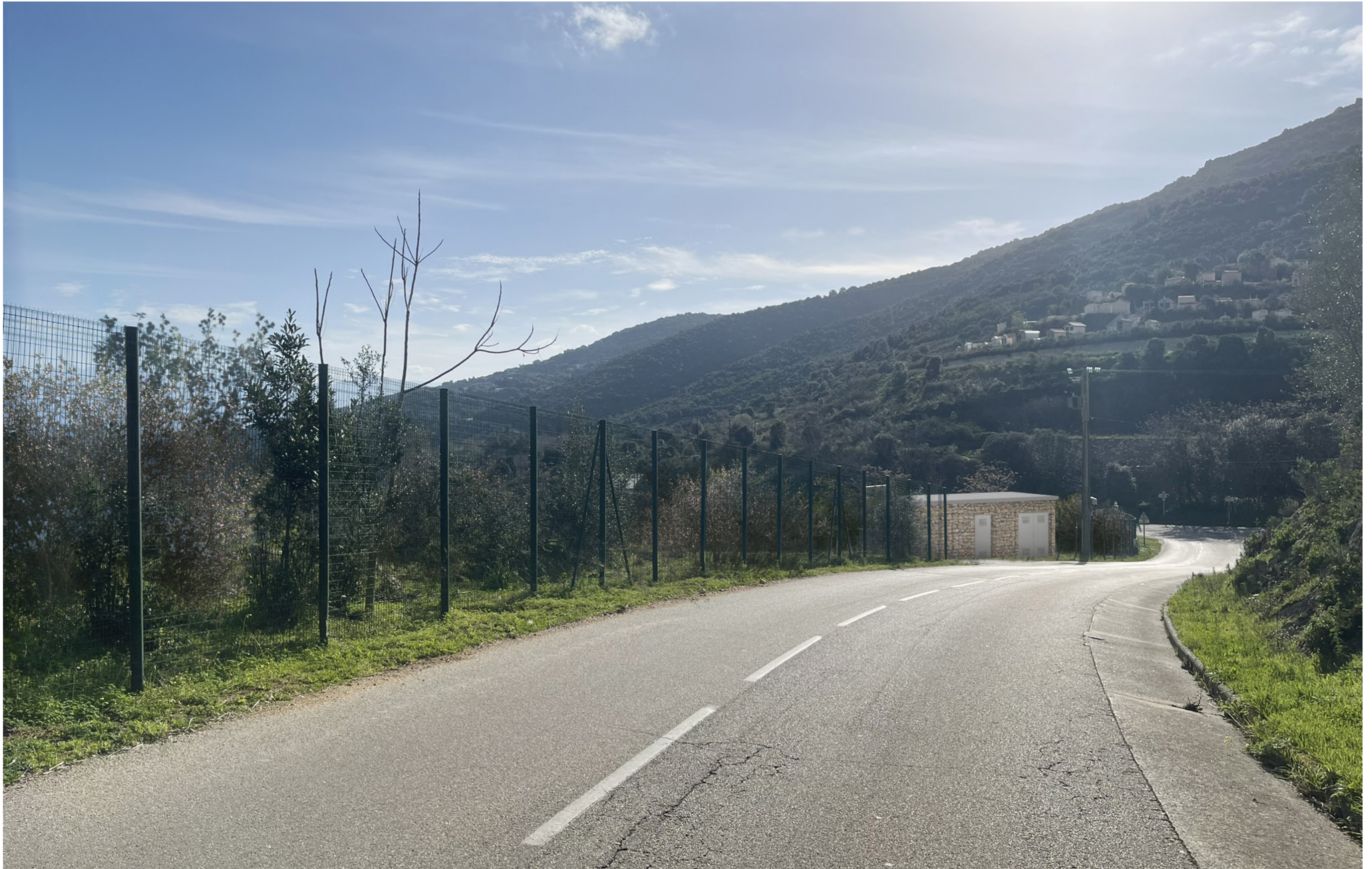
PDV 2- Vue depuis la route départementale n°11b à l'est du site en direction du sud-est