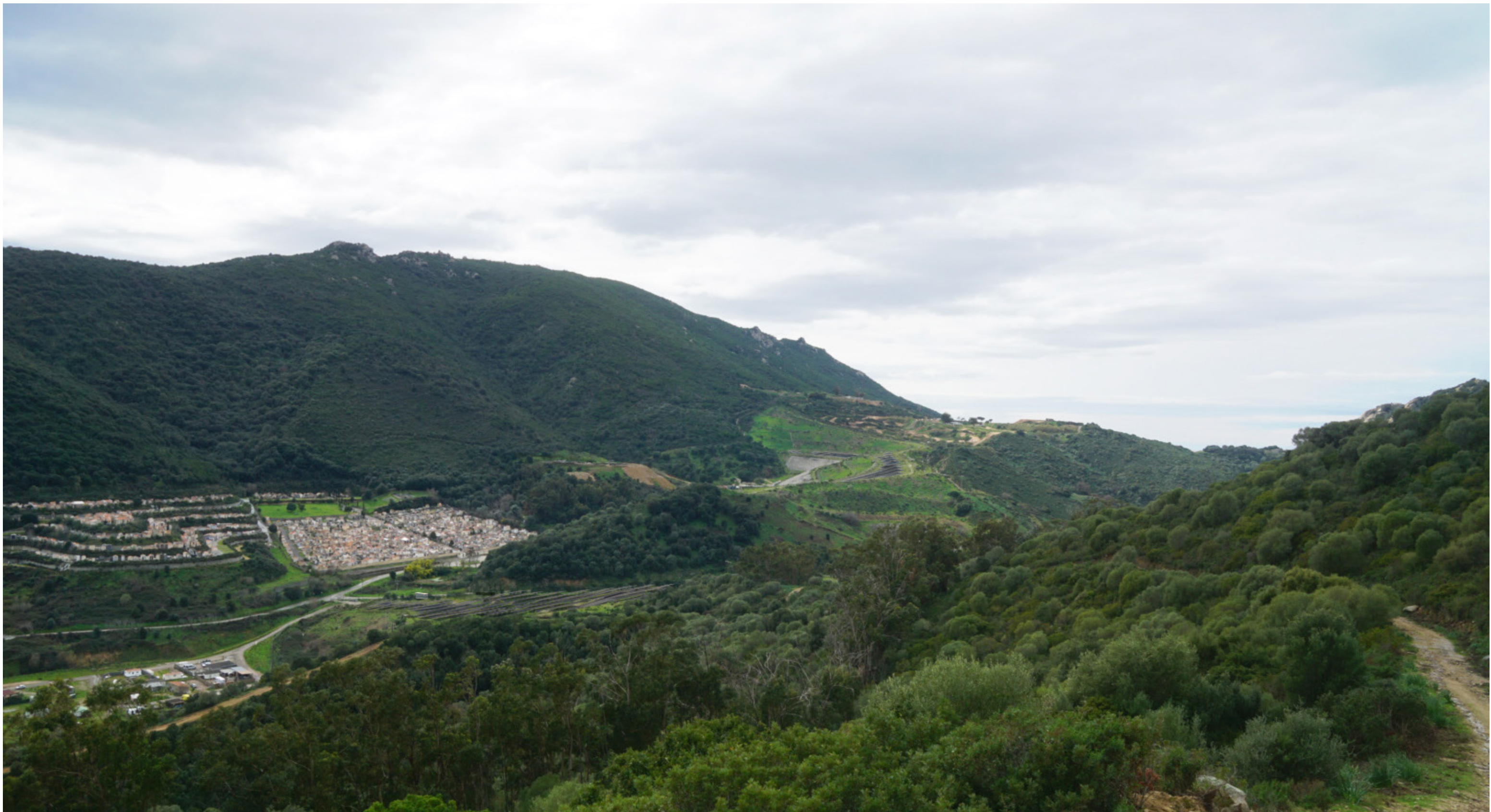
PDV 8 - Vue depuis le coteau nord et le sentier menant au barrage de Lisa