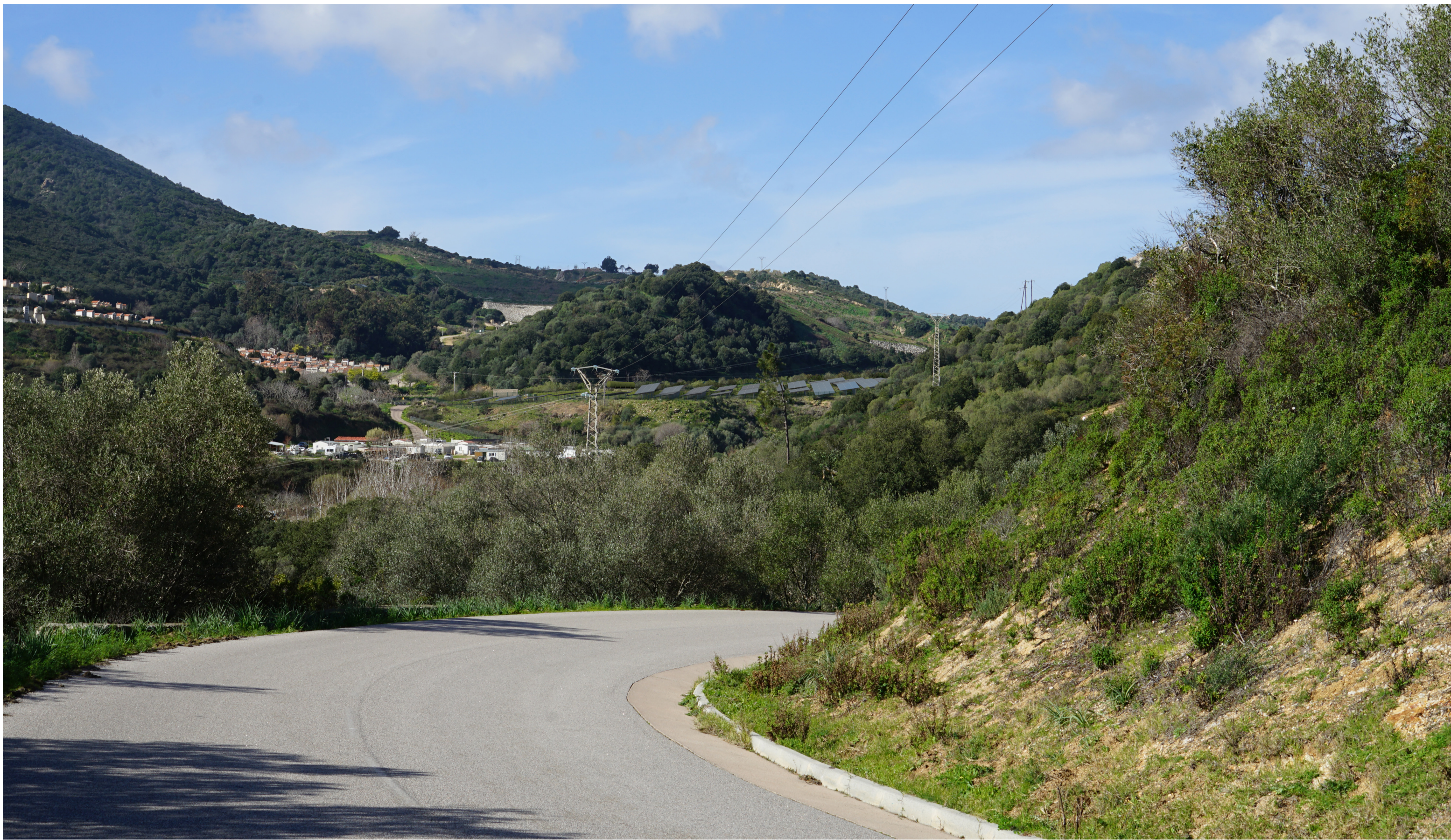
PDV 9- Vue depuis la Route Départementale n°11a à l'est, menant à Castelluccio