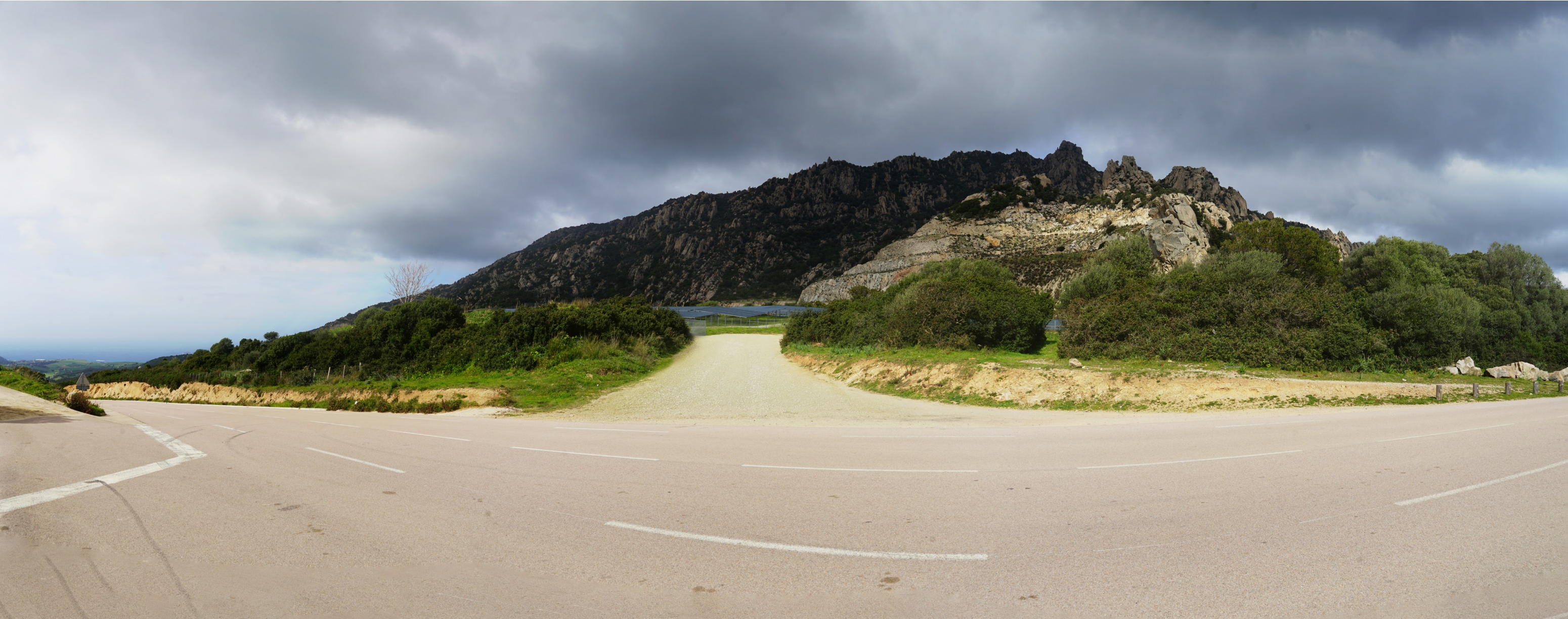
PDV 1- Vue depuis le sud de l'accès à la zone ouest du site