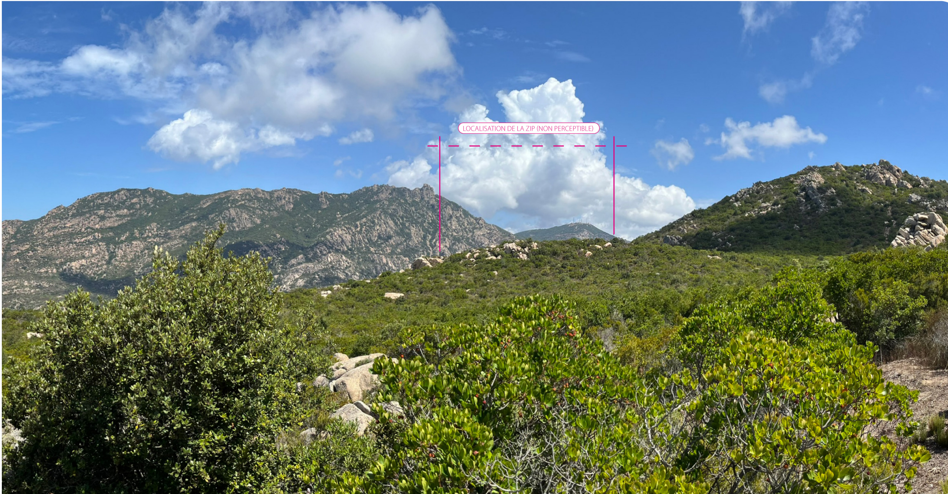
PDV 5- Vue depuis le sentier des crêtes au sud-ouest