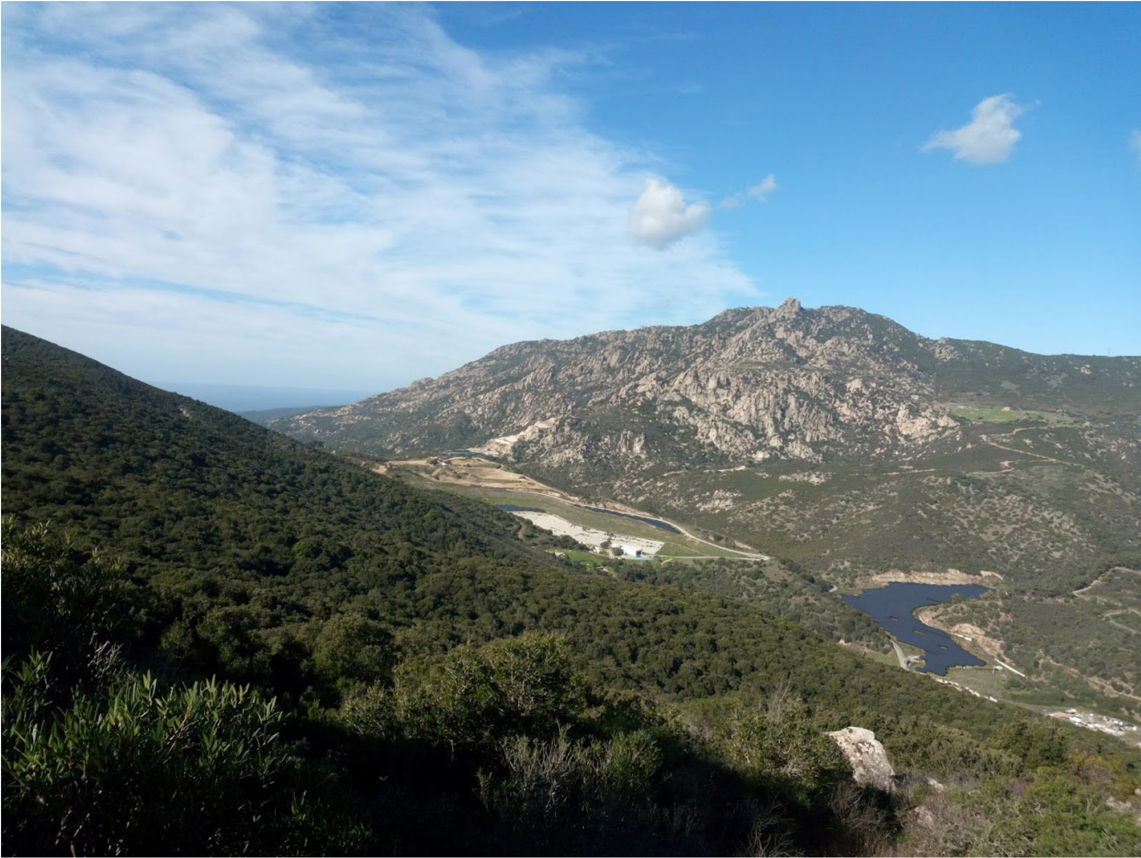
PDV 4 - Vue depuis Salario au sud-est du site en direction du nord-ouest