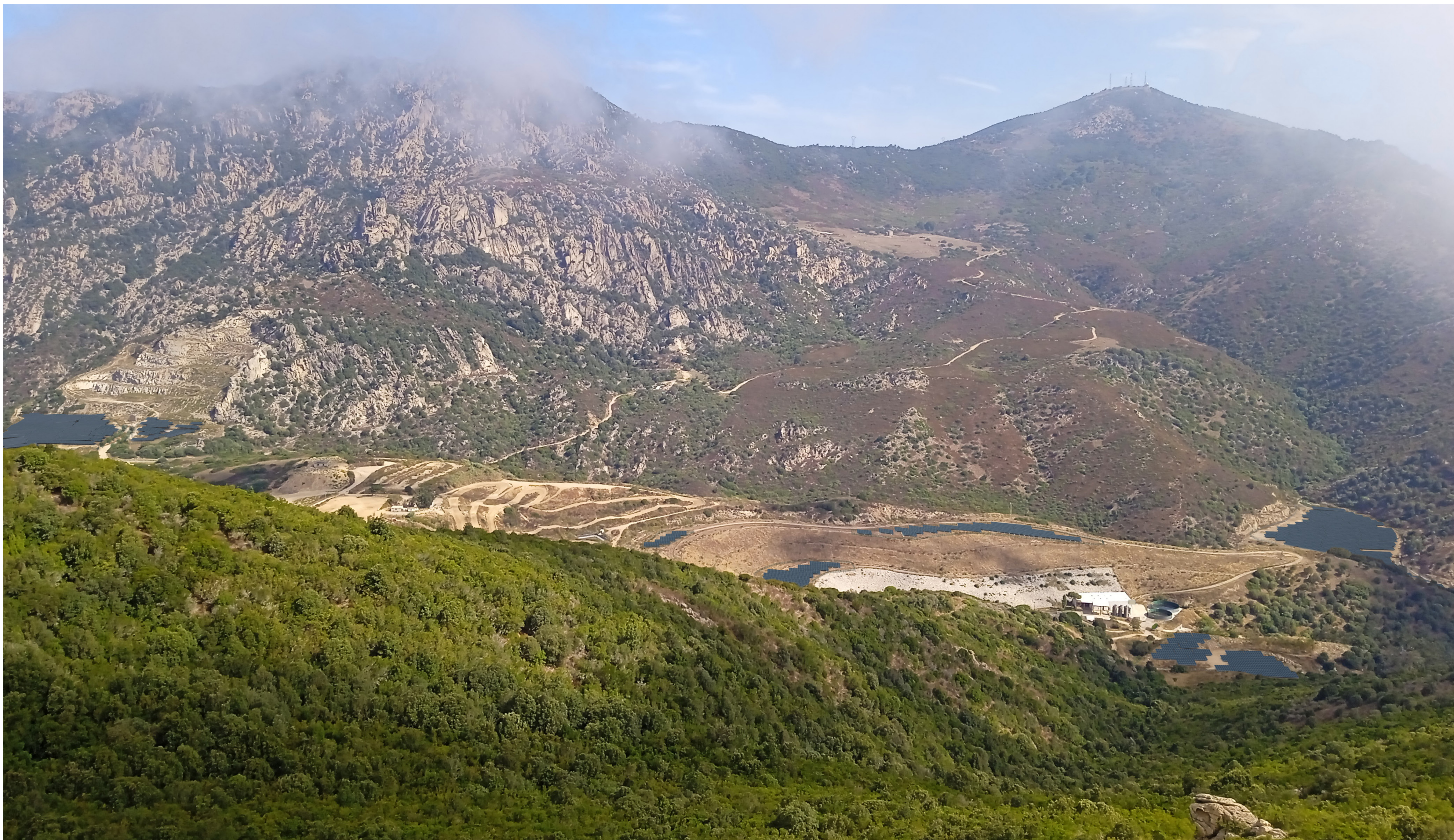
PDV 7- Vue depuis le sentier des crêtes sur le coteau sud