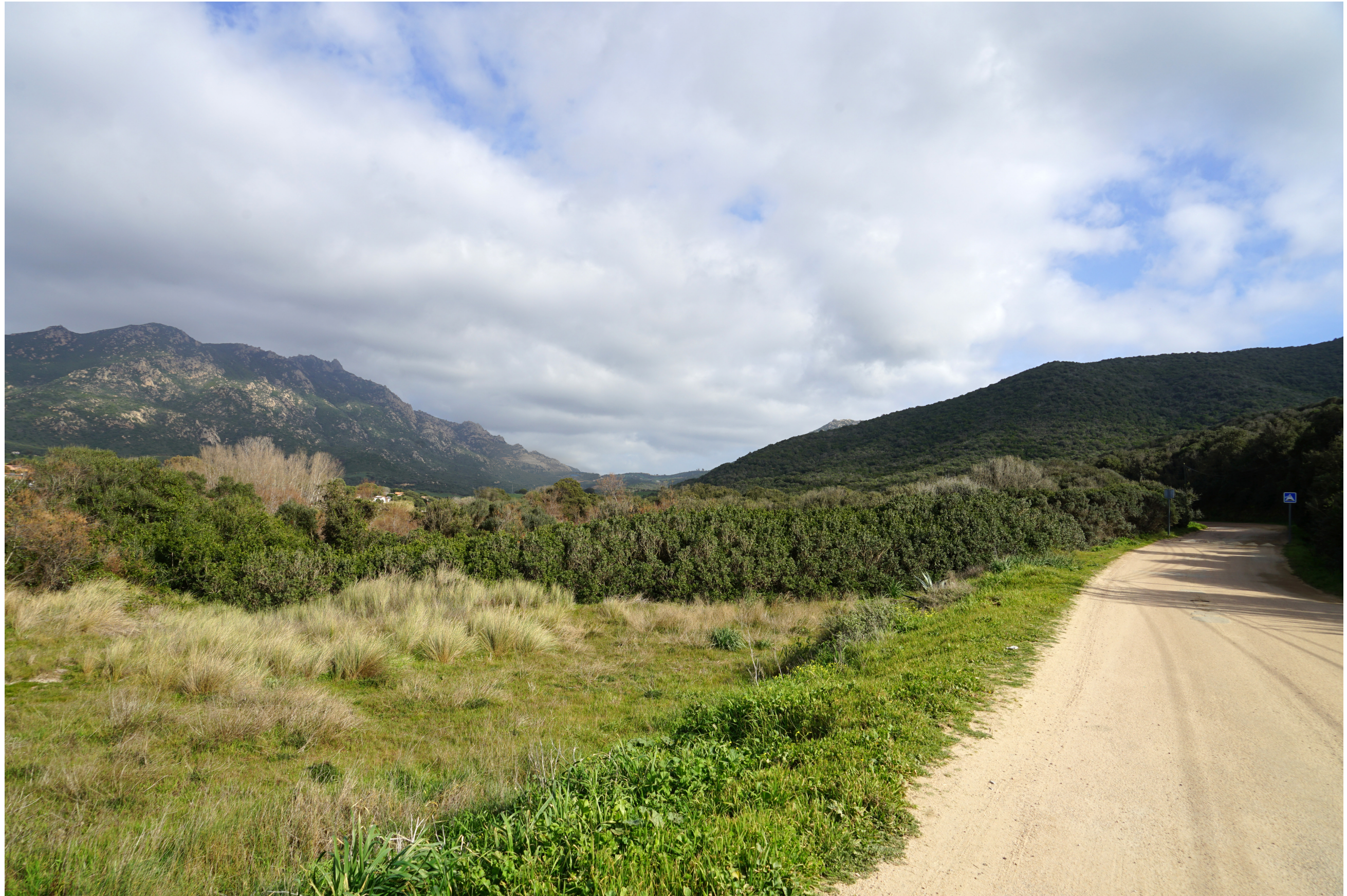
PDV 3- Vue aux abords de la plage de Saint-Antoine à l'ouest du site en direction de l'est