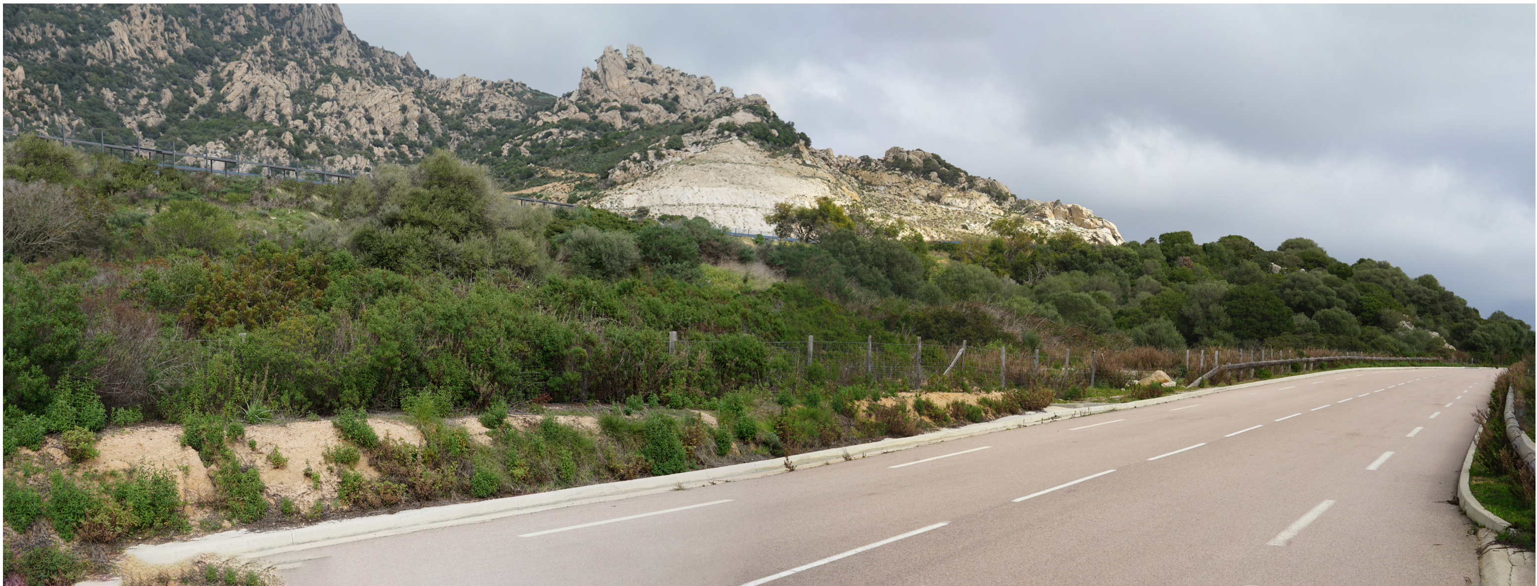
PDV 6 - Vue depuis la Route départementale n°11b longeant le site de Pompéani