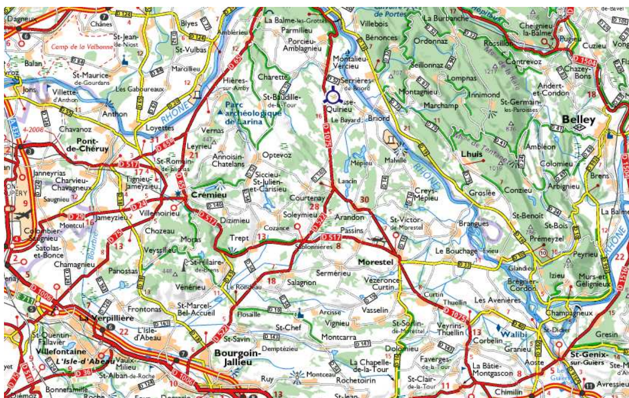
Situation géographique de Bouvesse-Quirieu

La commune de Bouvesse-Quirieu bénéficie d'une altitude moyenne de 220 m.