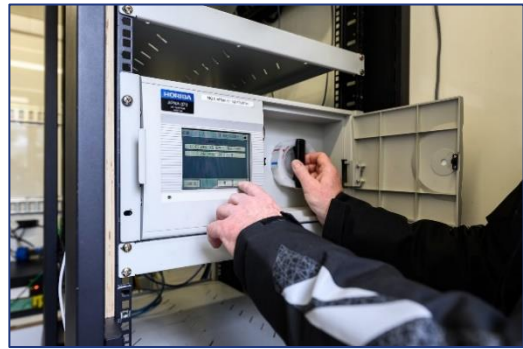
Station de mesure Atmo Auvergne-Rhône-Alpes et exemple d'analyseur automatique

Une remorque équipée d'analyseurs de PM10 et PM2.5 et d'un analyseur de NOx sera déployée sur un site. Les appareils sont conformes à la mesure réglementaire en air ambiant. Nous proposons d'équiper également la remorque d'un analyseur aethalomètre type AE33 permettant la mesure du black carbon lié au « fuel fossile » et lié au « wood burning » (combustion biomasse).