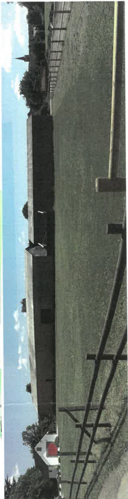
Vues de l'environnement du bâtiment