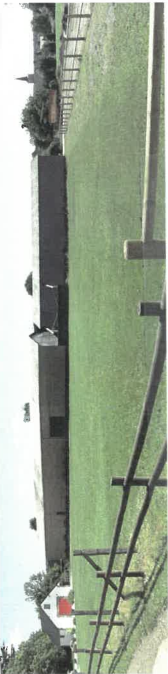
Vue du hangar existant depuis le chemin de Lattets