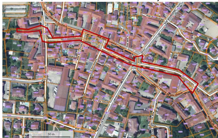
Figure 1 : Plan des limites cadastrales et périmètre de l'opération