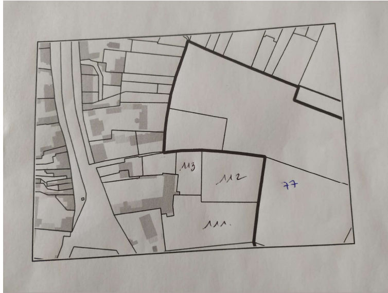
Extrait du cadastre de la commune de Ciel, précisant les parcelles dont nous sommes propriétaires

Notre maison d'habitation, composée de deux logements sur deux étages, a une façade plein Est, avec portes, fenêtres et balcon donnant sur la parcelle B112 (2830 m 2 ). Cette parcelle est occupée par un verger, intimement lié à l'habitation (voir photo ci-après).