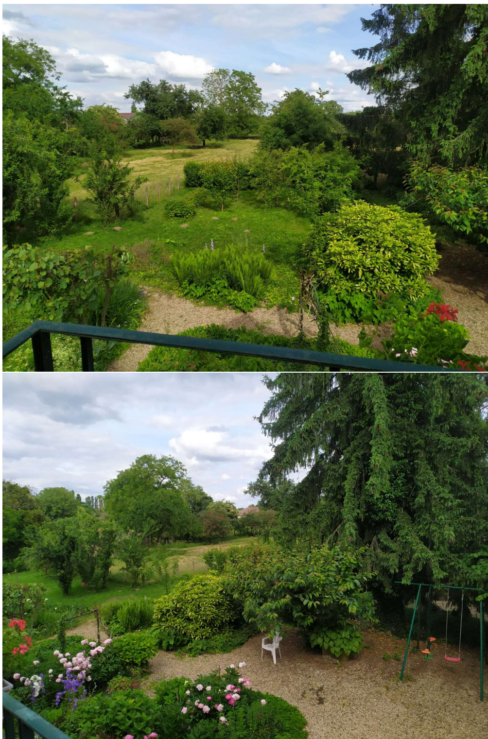
Vues sur la parcelle B112, depuis le balcon à l'étage de notre habitation