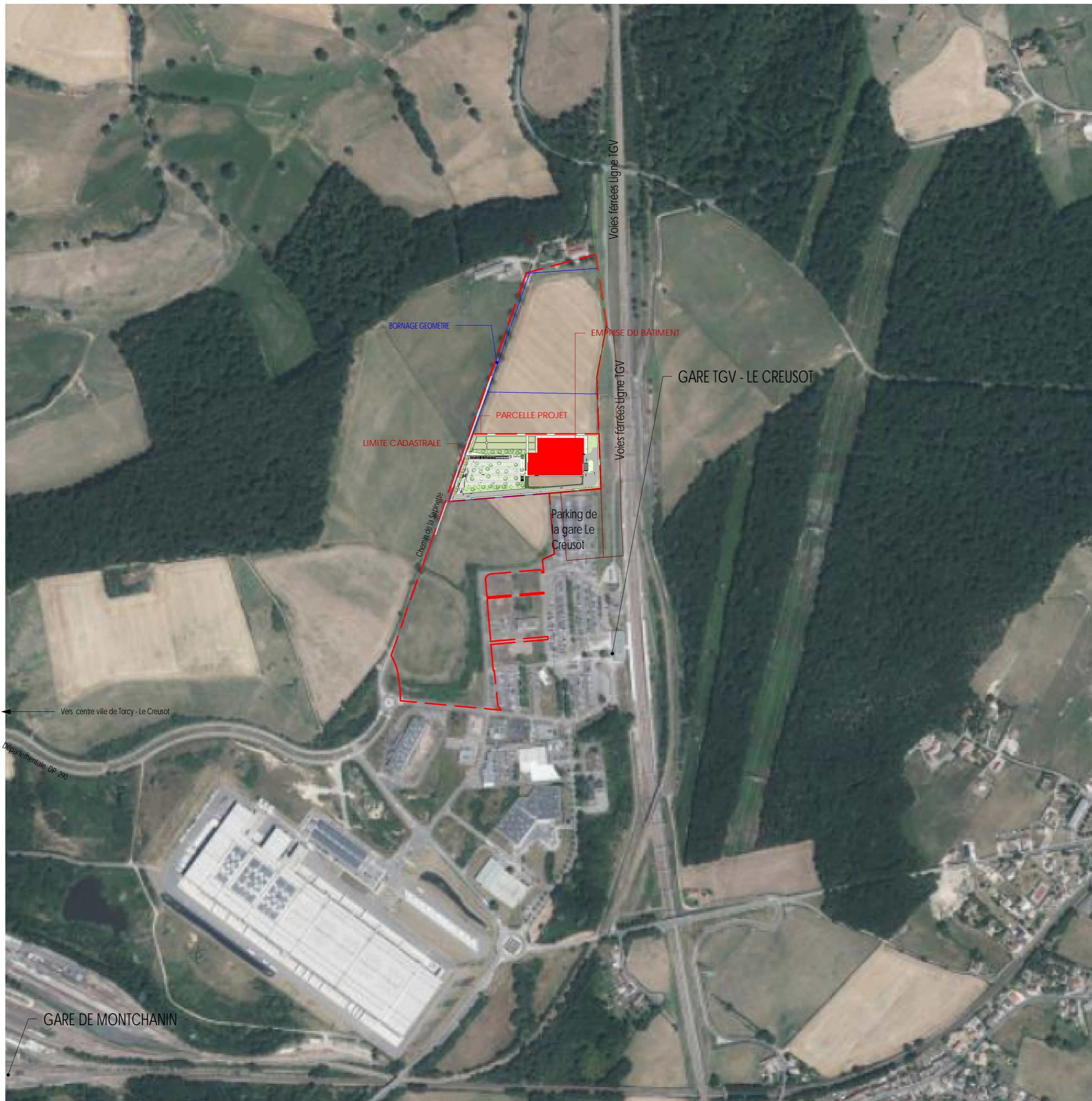
PLAN DE SITUATION Ech : 1 : 5000

Propriété intellectuelle. L'article L1111-1 du Code de Propriété Intellectuelle pose pour principe que l'architecte « ... jouit sur [son] œuvre, du seul fait de sa création, d'un droit de propriété incorporelle exclusif et opposable à tous » qui comporte « des attributs d'ordre intellectuel et moral ainsi que des attributs d'ordre patrimonial. » L'article L650-2 du Code du Patrimoine stipule que « Le nom de l'architecte auteur du projet architectural d'un bâtiment et la date d'achèvement de l'ouvrage sont apposés sur l'une de ses façades extérieures. »