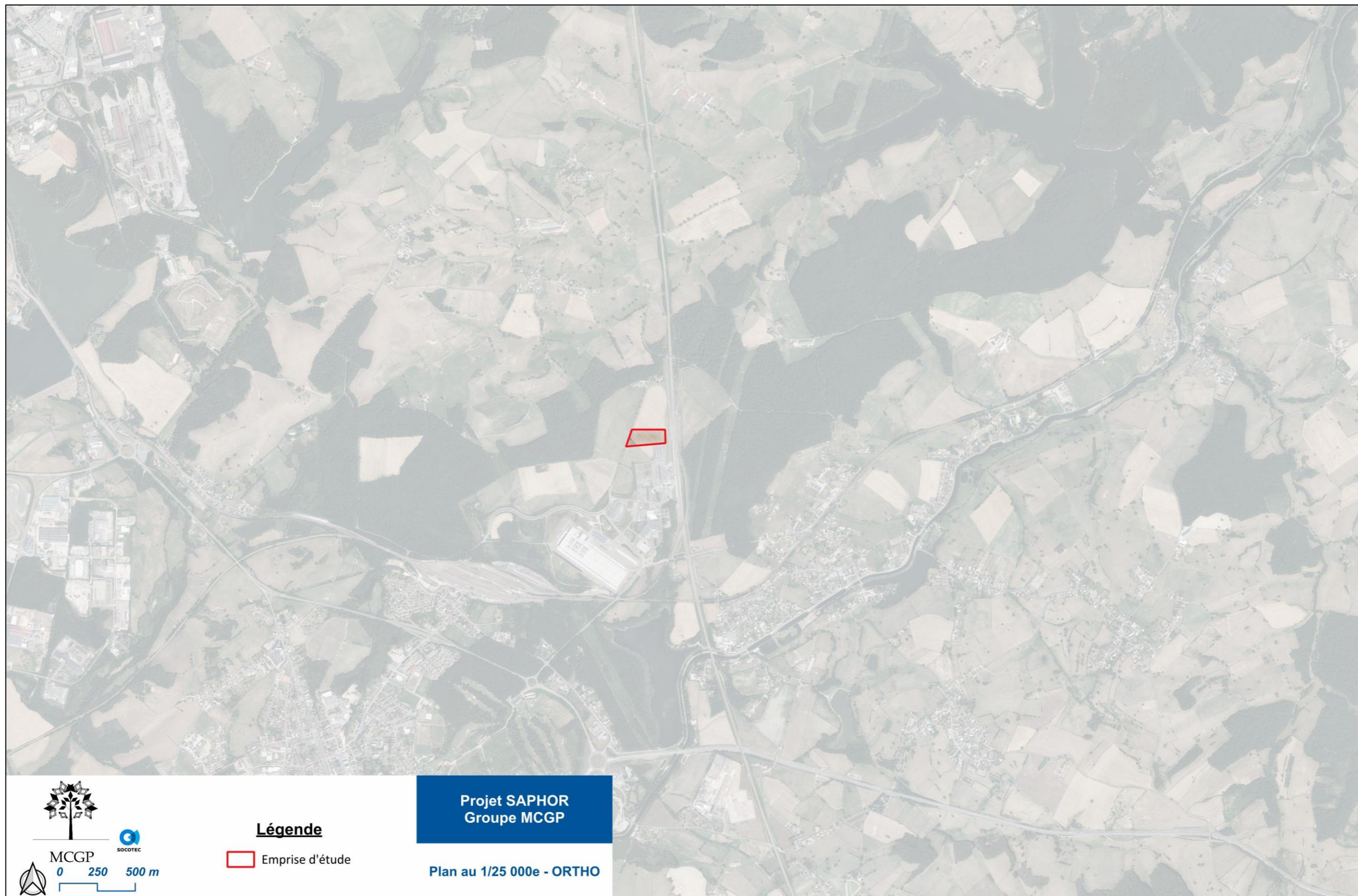
Figure 2 : Plan à l'échelle 1/25 000 e – Fond ORTHO