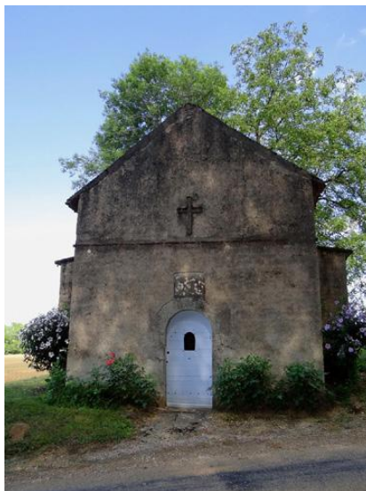
Chapelle des Malades

Le projet éolien de ROCHE ET RAUCOURT se composerait de 5 éoliennes de 230 mètres de haut . Le mât E2 se situe à 1 120 mètres du bourg .