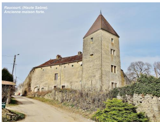
Maison forte de RAUCOURT

A RAUCOURT : une maison forte, deux chapelles : Saint-Roch et Saint-Claude, un lavoir et aussi quelques calvaires.