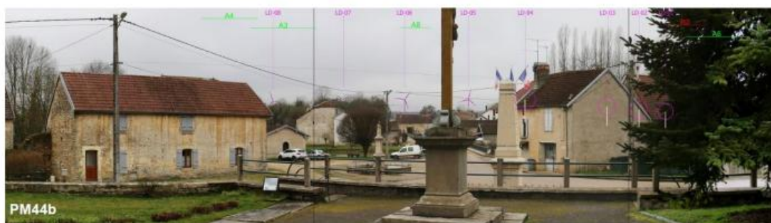
Figure 21 : Vue depuis le parvis de l'église de Roche (les éoliennes du projet Les Petits Bois figurent en rose)

ROCHE ET RAUCOURT va subir la covisibilité de 4 éoliennes du projet des Petits Bois depuis le parvis de l'église.